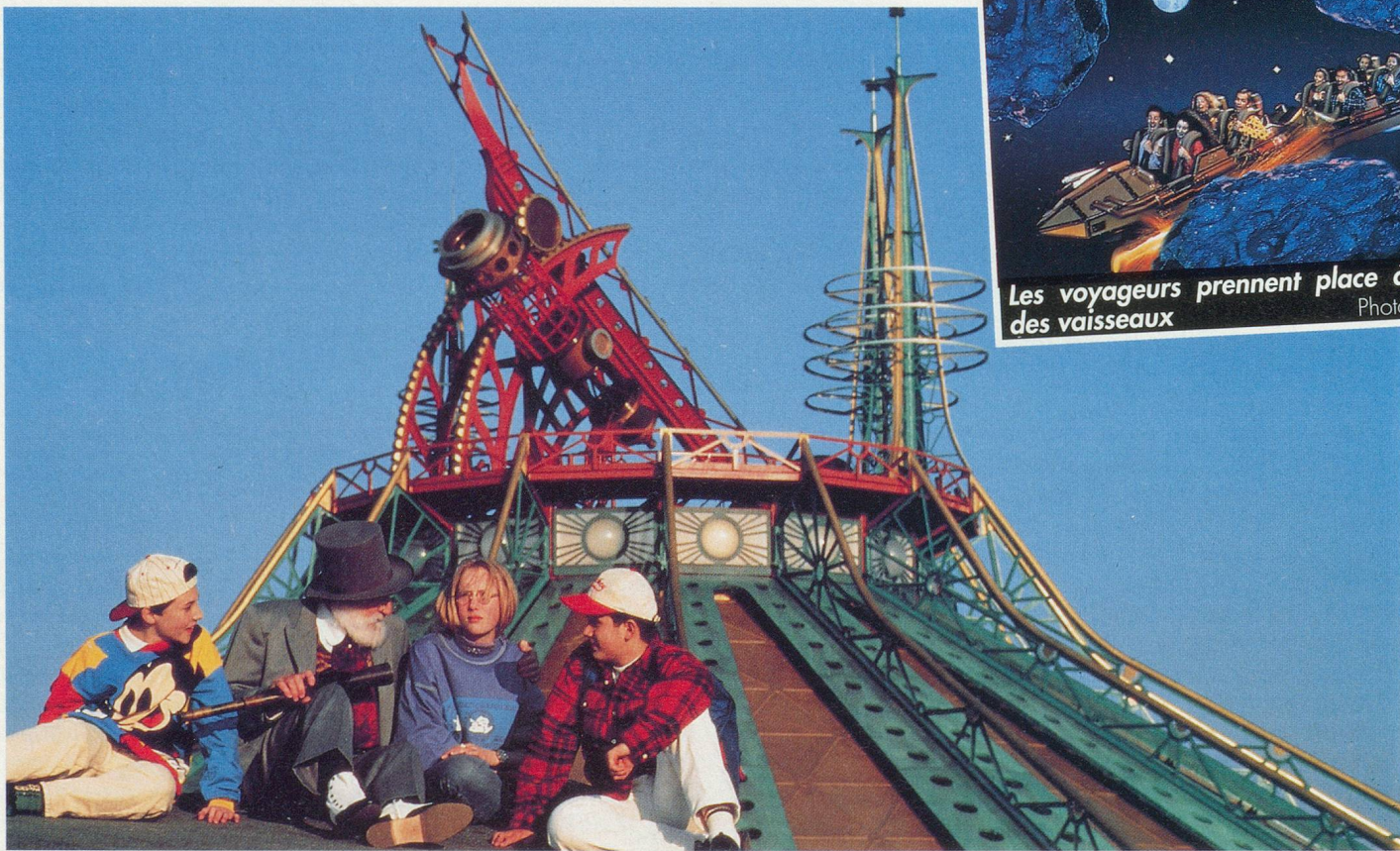
La montagne de l'espace, un hommage à Jules Verne