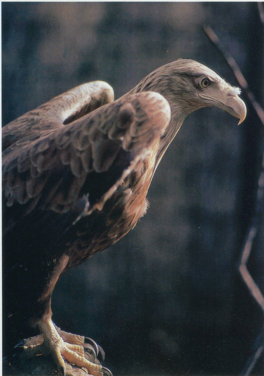
Comme tous les rapaces, l'aigle choisit sa victime

Nous avons vraiment de la chance, nous les humains car, lorsque nous avons une petite faim, il nous suffit d'ouvrir le réfrigérateur, de prendre l'ouvre-boîtes et d'enclencher le four micro-ondes. A moins que nous n'hésitions entre la pizza du coin et le déplacement chez Girardet qui n'attend que nous. Il en va autrement chez les animaux!