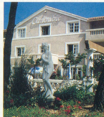
L'Hostellerie du Canoubié

Inclus dans le prix: transport en autocar, logement en chambre double, repas à Valence, pension complète, vin compris, accompagnement dès la Suisse.