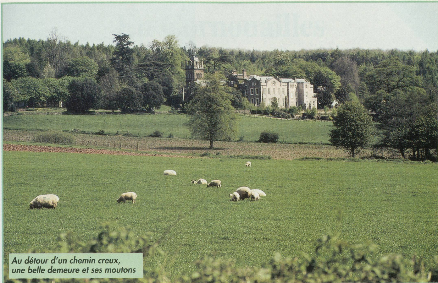
Au détour d'un chemin creux, une belle demeure et ses moutons