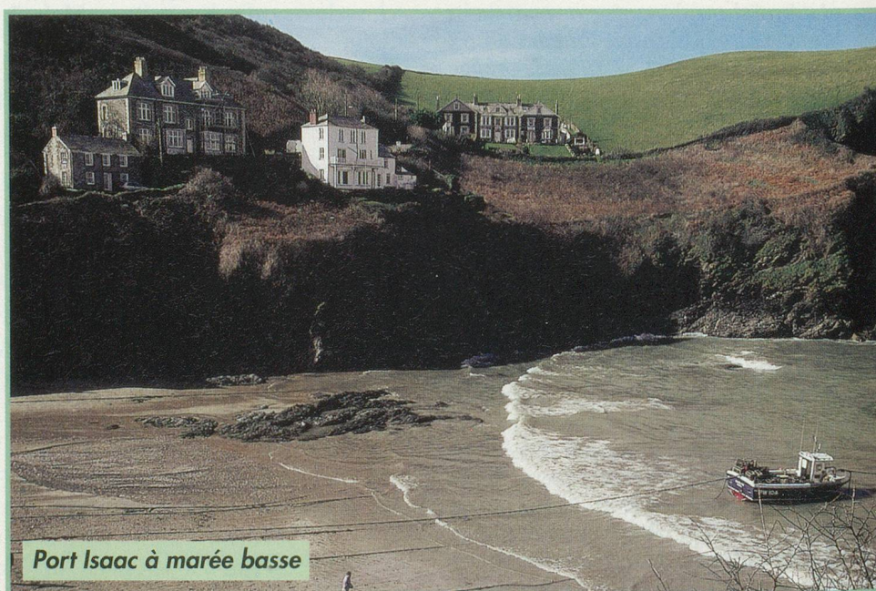
Port Isaac à marée basse

Les Anglais aiment la marche à pied. Ils ont créé tout un réseau de ►