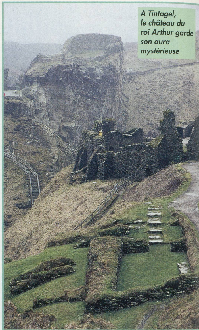
A Tintagel, le château du roi Arthur garde son aura mystérieuse

Pour expier, une bonne balade s'impose. Et là, les buts abondent. Mais les jardins sont une priorité. Partout en Cornouailles, on rencontre un petit panneau brun assorti d'une fleur qui indique ces propriétés souvent immenses où depuis des siècles on a élevé le jardinage au rang d'art. The Lost Gardens of Heligan près de St Austell est l'exemple même de cet amour pour la nature et ses prodiges. Le parc d'Heligan avait été laissé à l'abandon pendant près de septante ans, quand un horticulteur australien s'est mis en tête de le restaurer en 1991. Dans cette propriété, les rhododendrons centenaires se mêlaient aux palmiers et aux fougères arborescentes les plus folles. Il a fallu élaguer, reconstituer les serres où il y a plus de deux cents ans, on cultivait déjà des ananas. Le jardin est divisé en deux parties: le nord où poussent des camélias, des magnolias et un immense potager à l'ancienne. Au sud, la jungle reconstituée dans un petit vallon vous fait admirer des bambous, des araucarias, bref une petite portion de tropique sud-américaine. Dans la boutique du jardin, on peut même acheter des graines à planter chez soi, si l'on ne craque pas pour une jolie théière. Heligan n'est qu'un exemple de cette exploitation si harmonieuse de la nature dans laquelle les Anglais excellent. Le mignon «Longcross Victorian Garden» près de Port Isaac est aussi un petit bijou, où l'on trouve à l'ombre des arbres une petite fontaine, un pigeonnier et