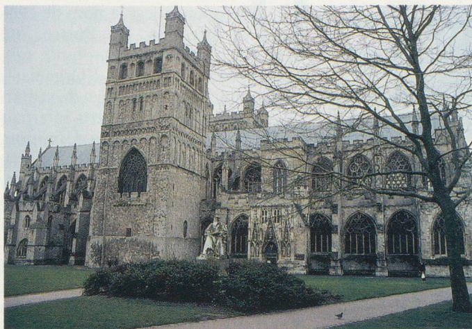
La prestigieuse cathédrale d'Exeter, aux portes des Cornouailles

Visite d'un magnifique jardin avec des plantes tropicales et des fleurs à profusion. Déjeuner à St Austell.