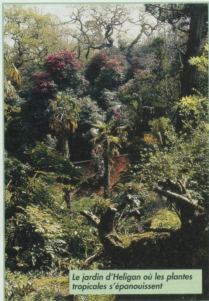
Le jardin d'Heligan où les plantes tropicales s'épanouissent