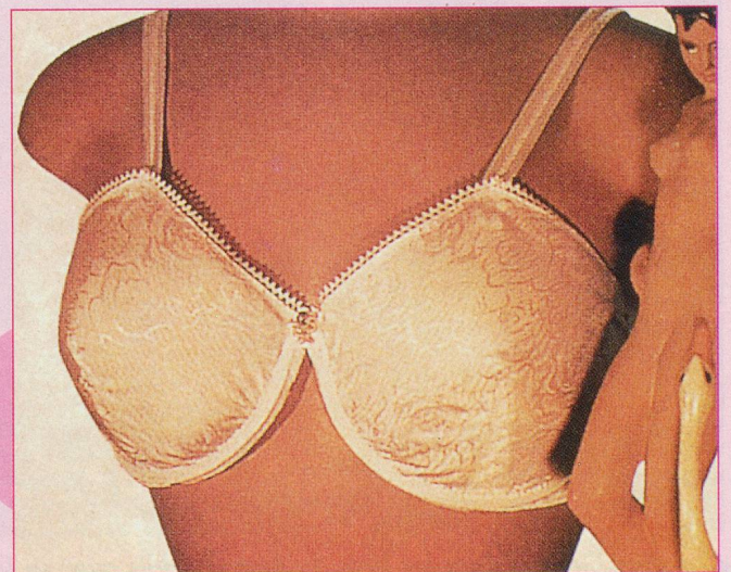
Créé en 1917, le «Delineator» de Berlé fait paraître la poitrine deux tailles de moins