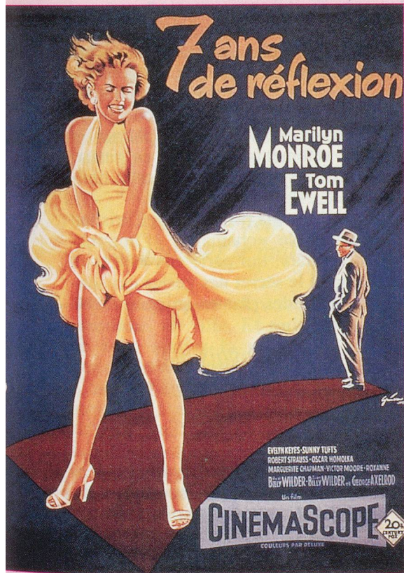
Hollywood et ses femmes fatales marquent les années 50