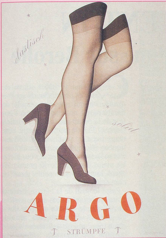
Le bas de soie est un luxe dans les années 40

Pour remonter le moral des troupes, en 1940, on invente la pin-up aux formes généreuses