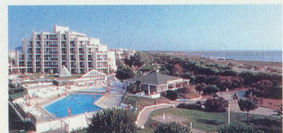
THALASSA PORT CAMARGUE - MERCURE Face à l'une des plus grandes plages de Méditerranée