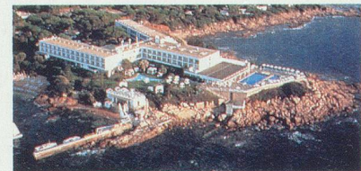
THALASSA PORTICCIO - SOFITEL Un site magique dans l'île de beauté