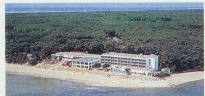
THALASSA OLERON - NOVOTEL Entre mer et forêt, au coeur d'un milieu naturel exceptionnel