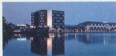
THALASSA CARNAC - NOVOTEL & IBIS Face à l'Atlantique, aux sources de l'énergie