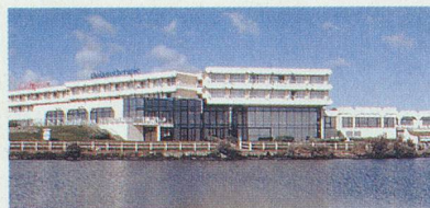
THALASSA LES SABLES D'OLONNE - MERCURE Face à l'océan, au coeur de la Vendée