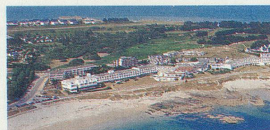
THALASSA QUIBERON - SOFITEL & IBIS Le berceau de la thalassothérapie moderne