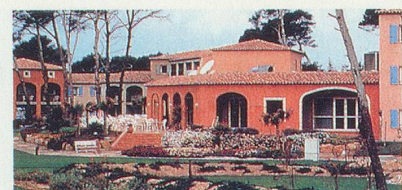
THALASSA HYERES - IBIS A la pointe de la douceur méridionale