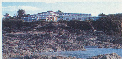
THALASSA DINARD - NOVOTEL La perle de la côte d'Emeraude