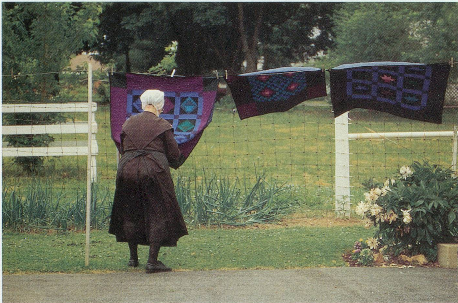
A l'heure de la retraite, les femmes amish confectionnent des quilts

Bien qu'ils vivent selon des règles établies au 17 e siècle, les Amish ont su créer une société qui intègre harmonieusement les personnes âgées. Un exemple à méditer. Reportage de notre collaborateur qui a vécu dans une communauté Amish des Etats-Unis.