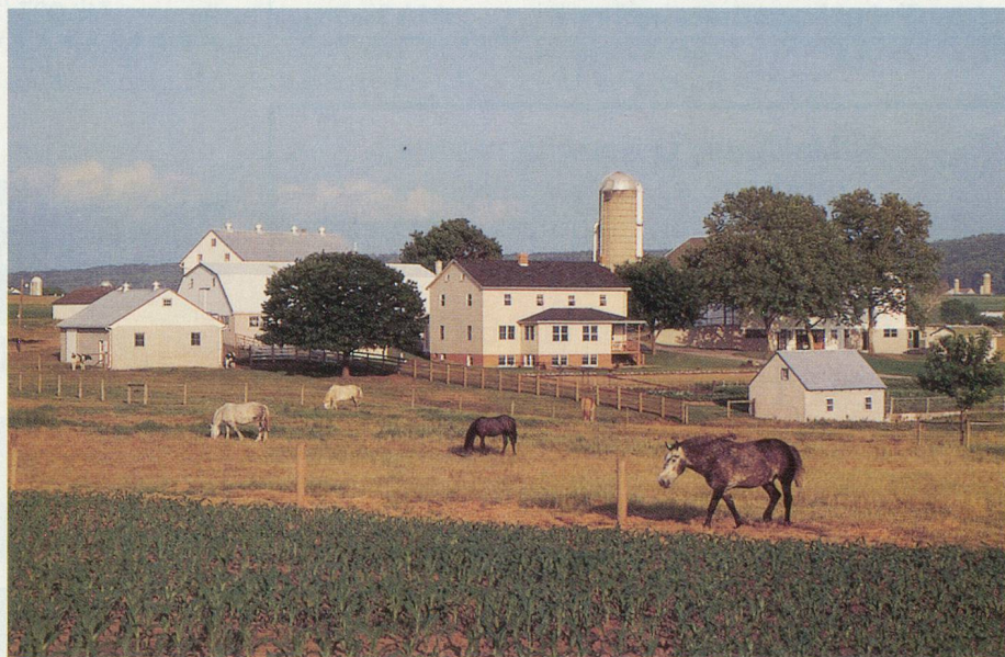
Autour de la ferme, les maisonnettes accueillent les aïeuls

Il ne fut guère facile aux Amish de convaincre l'Internal Revenue Service (l'IRS, la toute puissante administration fédérale chargée de collecter