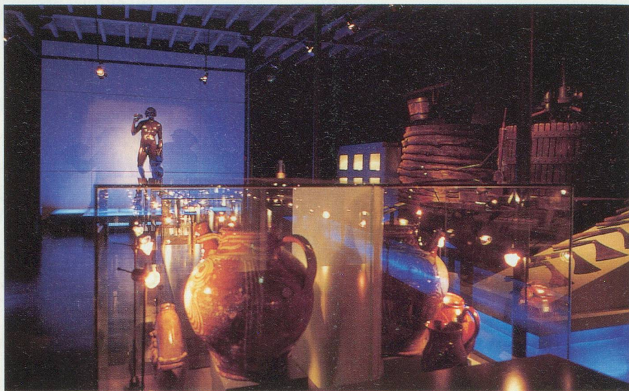
La salle principale du Hameau du Vin accueille 100 000 visiteurs par année

lais, nous vous invitons à effectuer un pèlerinage à Romanèche-Thorins, au Hameau du Vin.