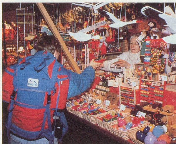
Le marché de Noël, une tradition alsacienne

Transfert en car de la Suisse et retour, logement en cabine double, extérieure, douche, WC, la pension complète, l'accompagnement d'un guide au départ de la Suisse. Le prix ne comprend pas les boissons et dépenses personnelles, les excursions facultatives, l'assurance annulation obligatoire.