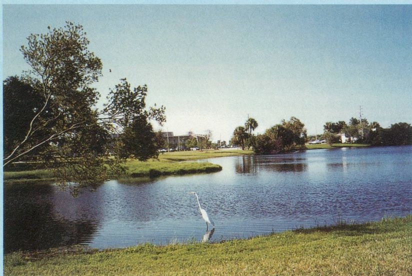
La Floride au printemps

Renseignements: «Planet Senior», 7, ch. du Péage, 1806 St-Légier. Tél. 021/943 61 19.