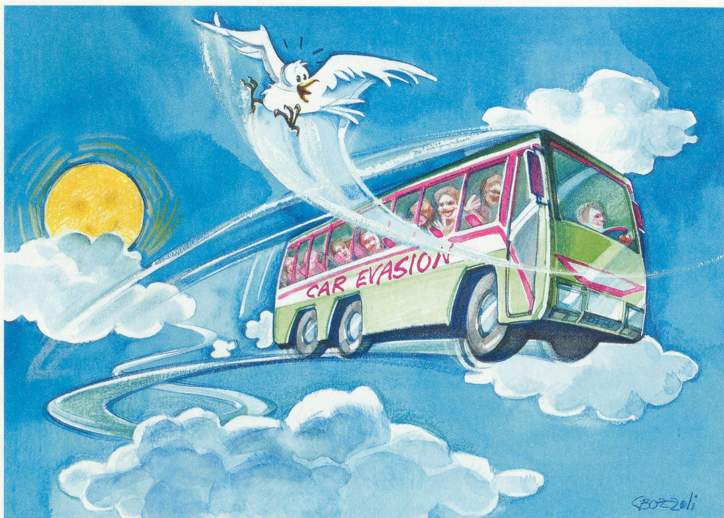
Dessin Cecilia Bozzoli

Les seniors aiment l'autocar qui les emmène, pour un jour ou une semaine, vers l'évasion. Les bagages suivent, l'accompagnateur est là pour tous les petits tracas, mais surtout il y a de l'ambiance! Rencontre avec quelques habituées qui racontent leur bonheur de voyager.