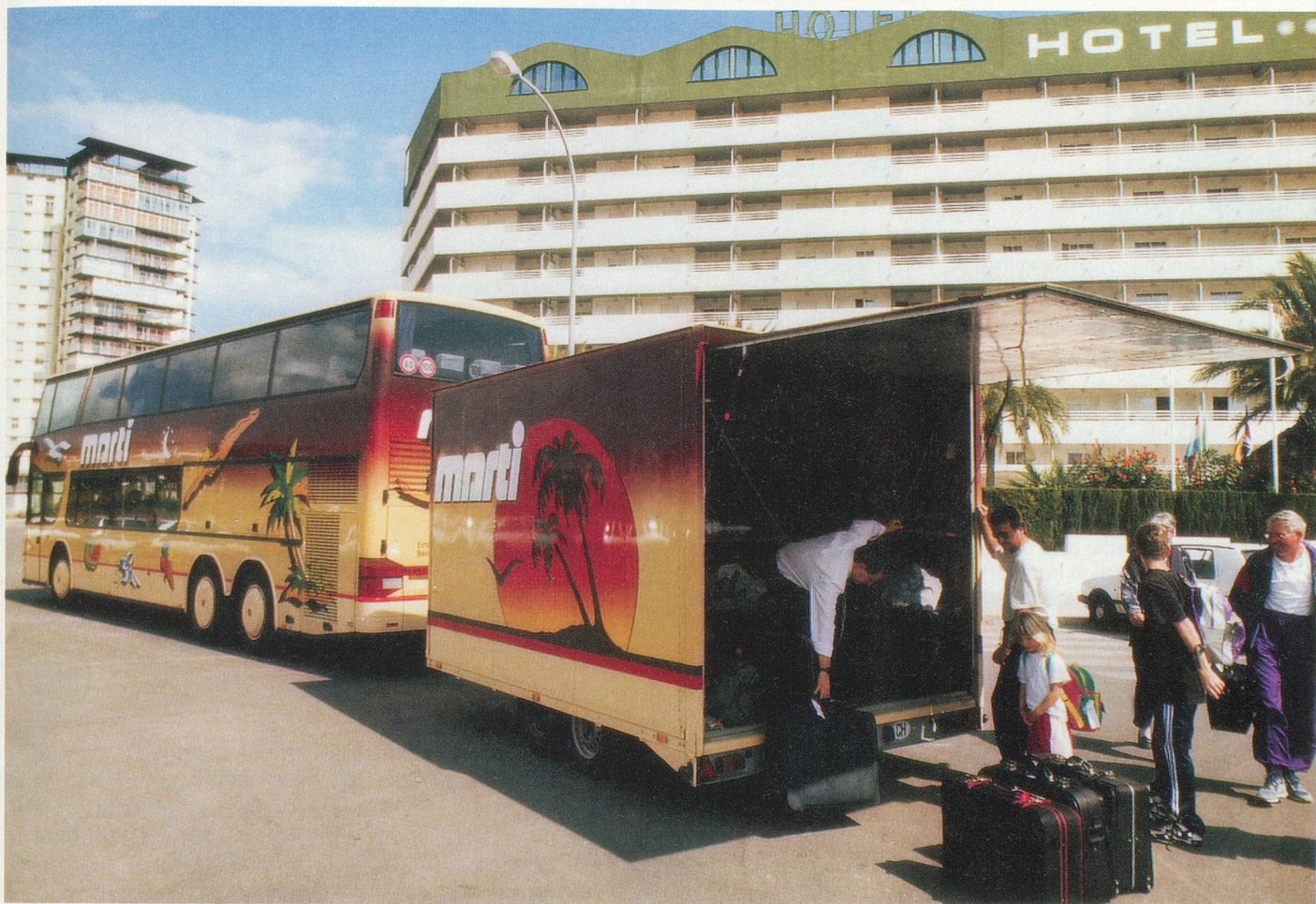
De nombreux seniors préfèrent le car pour voyager à l'étranger