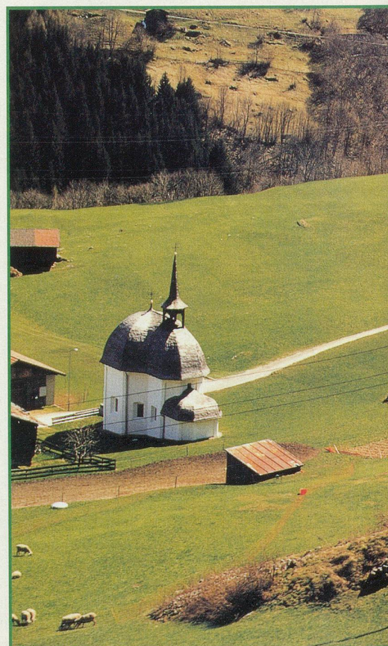
Fermes et églises grisonnes semblent jaillir de l'herbe