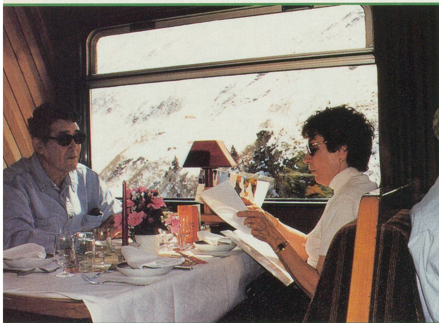
Au wagon restaurant, un repas au milieu des neiges éternelles