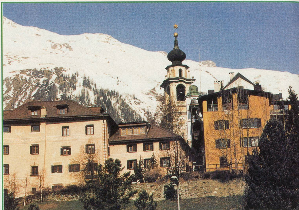
Le clocher noir de Samedan