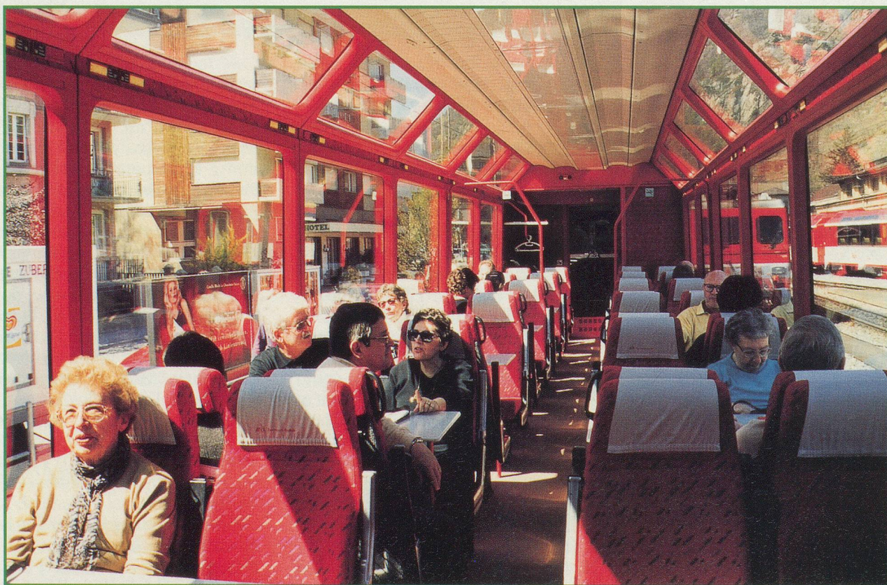
Les wagons panoramiques: le spectacle a lieu partout à la fois

Côté estomac, le mieux est d'être prévoyant et de réserver une table au wagon-restaurant à l'achat de votre billet. Renseignez-vous également sur l'heure du premier et du deuxième service. Sinon, rabattez-vous sur le chariot de service ou sur vos propres provisions.