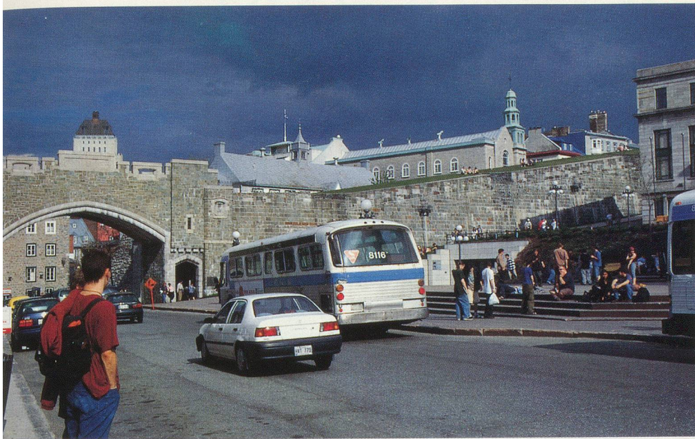
La porte Saint-Jean, à l'entrée du vieux Québec