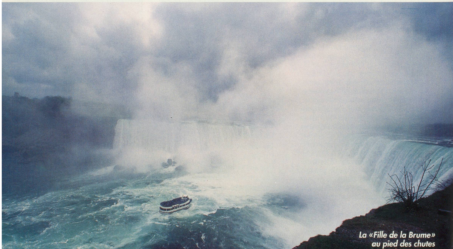
La «Fille de la Brume» au pied des chutes

Redécouvertes par le capitaine de La Salle à la fin du 17 e siècle, les chutes du Niagara avaient déjà alimenté une vieille légende indienne. La fille d'un chef, obligée d'épouser un guerrier valeureux mais affreux, préféra le banissement à une vie d'esclave. Après avoir erré des jours et des nuits, elle embarqua sur un canoë qui fut emporté par le courant. La belle périt dans les chutes mais, depuis, son esprit veille sur le Niagara. On prétend même qu'on peut l'apercevoir, à travers l'arc-en-ciel qui irise les chutes sous l'effet du soleil.