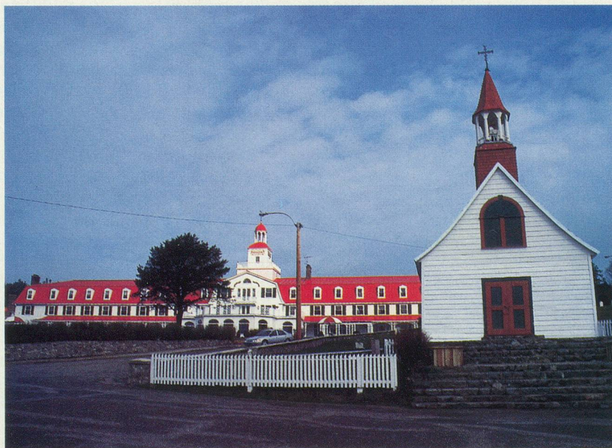
Le Grand Hôtel et la minuscule chapelle de Tadoussac

jourd'hui dans le petit village de Mashteuiatsh (Pointe-Bleue), qui longe le lac. Autres spécialités de la région: les bleuets (grosses myrtilles) et le traditionnel sirop d'érable.