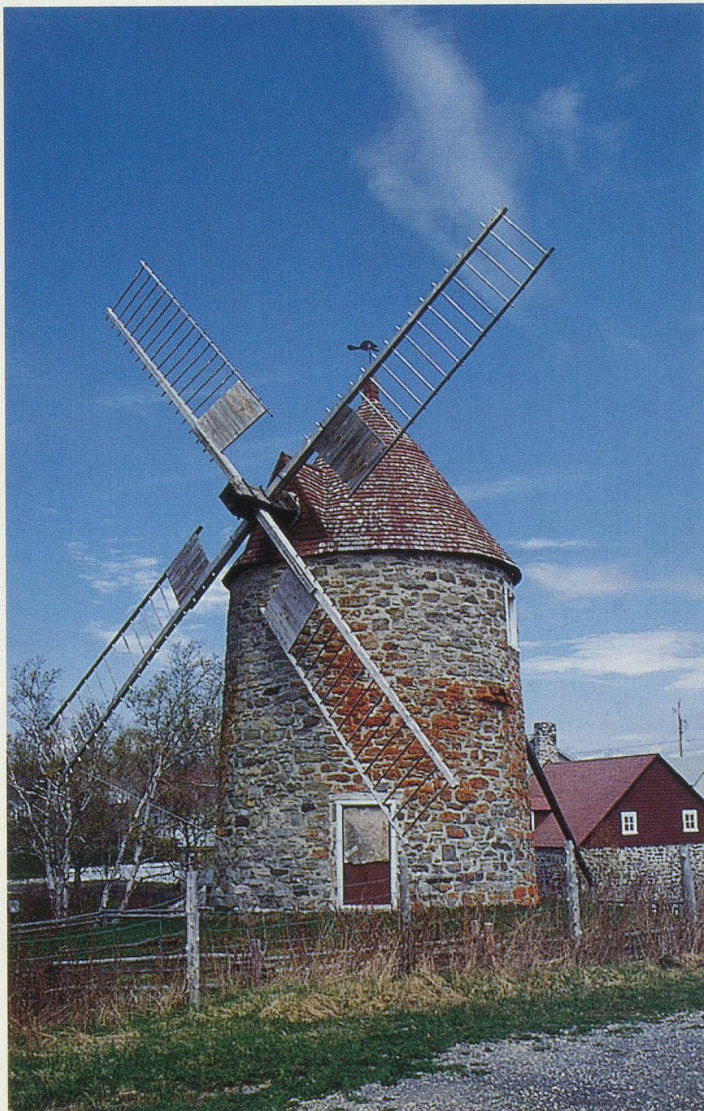
Vestige du passé, un moulin à vent sur l'île aux Coudres