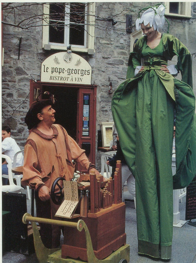
Des artistes de rue animent le quartier du Petit-Champlain

1534 , arrivée de Jacques Cartier au Canada; 1560 , début du commerce des fourrures; 1608 , Champlain fonde Québec; 1642 , Maisonneuve fonde Montréal; 1689-97 , première guerre franco-britannique; 1701 , paix de Montréal; 1760 , conquête du Canada par l'Angleterre; 1791 , acte constitutionnel; 1812-14 , guerre anglo-américaine; 1840 , union du Haut et du Bas-Canada; 1867 Confédération canadienne; 1948 , choix du drapeau à fleur de lys au Québec; 1977 , charte de la langue française; 1980 et 1995 , les Québécois refusent l'indépendance par référendum.