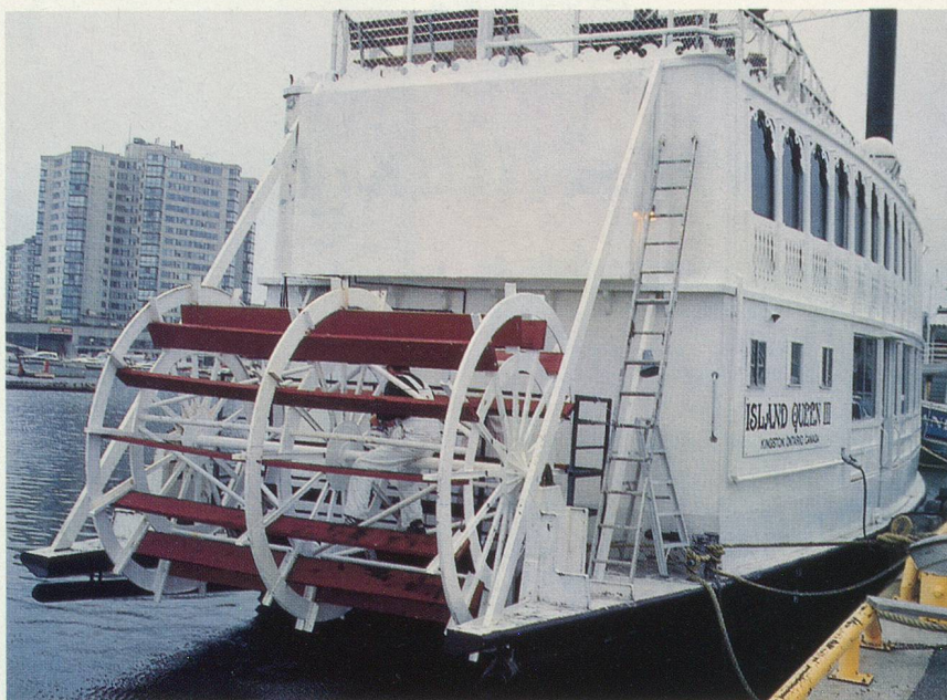
A Kingston, un bateau à aubes pour visiter les Mille-Iles

«Ce soir, au menu, nous vous proposons de la ouananiche...» Curieux nom pour un délicieux saumon d'eau douce, dont la saveur se situe entre la perche et la féra. Véritable emblème du lac Saint-Jean, la ouananiche figurait déjà au menu des Indiens Montagnais, regroupés au-