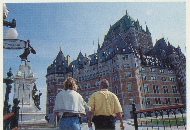
La statue de Champlain et l'imposant Château Frontenac