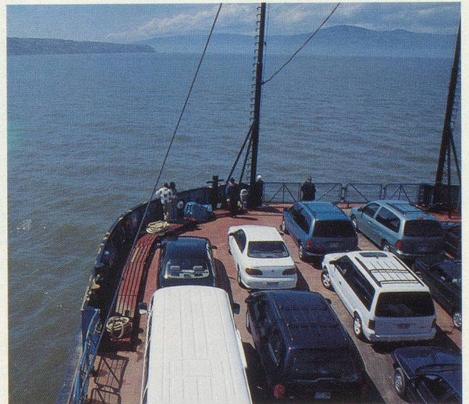
Le Saint-Laurent est sillonné de nombreux «traversiers»