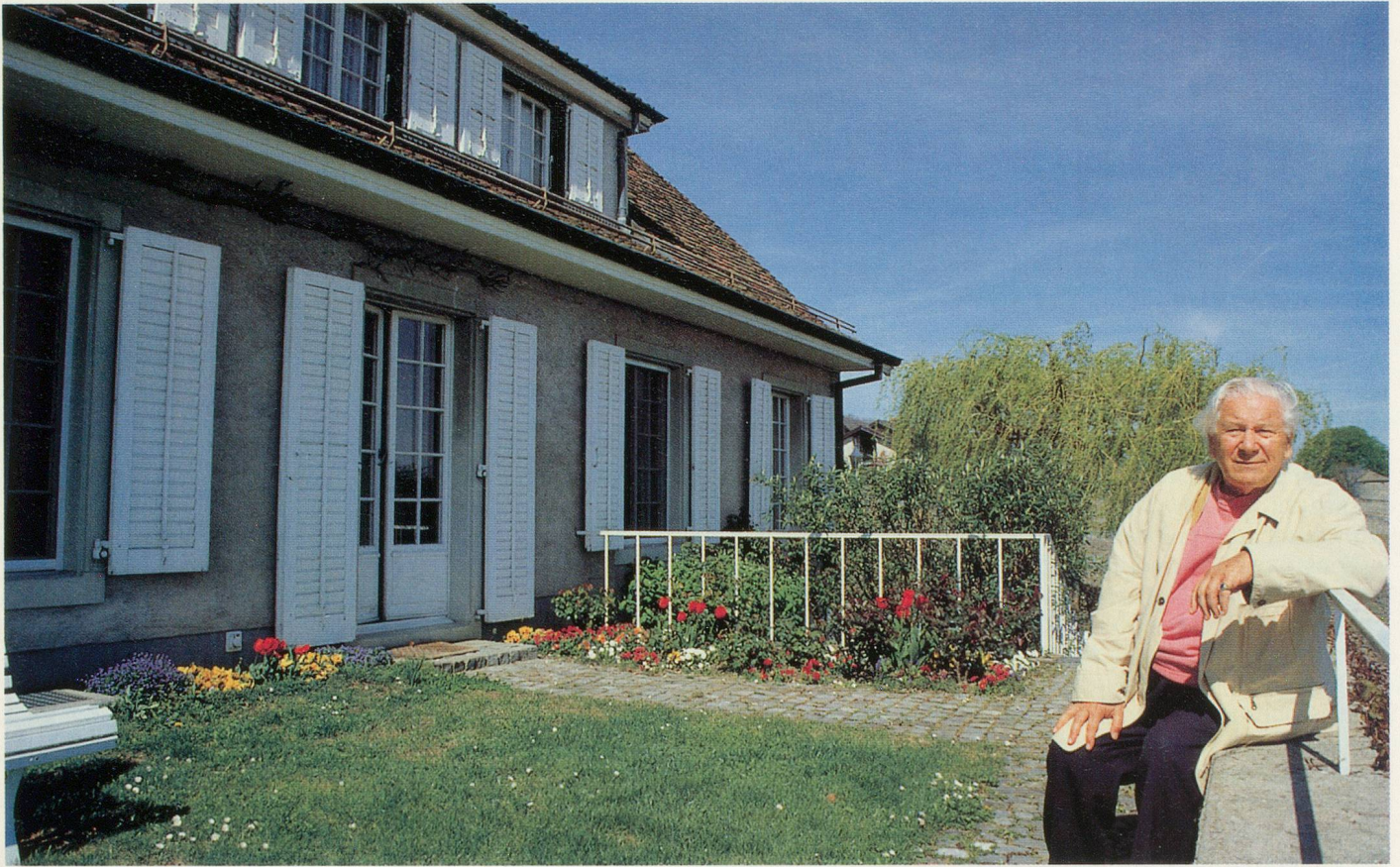
Peter Ustinov, devant sa maison vigneronne de la Côte

► donc ce qui me donne le plus de satisfactions. On est confronté à la page blanche. On s'assied un beau matin et on la remplit avec difficulté. Et puis, ça devient une habitude et, après 350 pages, on a terminé. Deux ans plus tard, on est assis chez soi en face d'un journaliste et on discute du résultat. Je trouve que c'est un miracle. Rien à voir avec l'opéra ou la scène. Jouer est une espèce de thérapie.