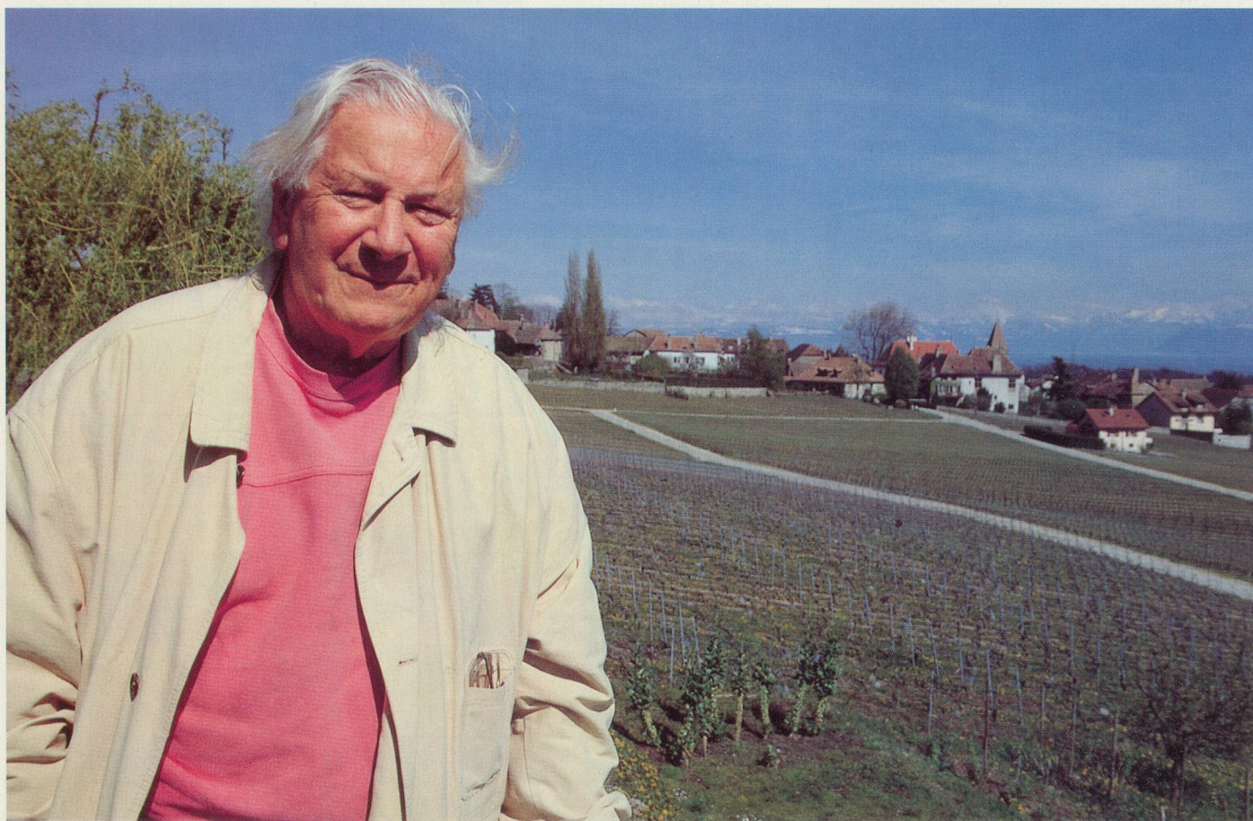
Peter Ustinov, au milieu d'un paysage dont il ne se lasse jamais

Aujourd'hui, il vit une retraite active dans une maison coquette, cernée par les vignes, au cœur de La Côte, entre Genève et Lausanne. C'est dans ce havre de paix qu'il nous a aimablement reçus, entouré de milliers de souvenirs qui racontent une vie semblable à un feu d'artifice.