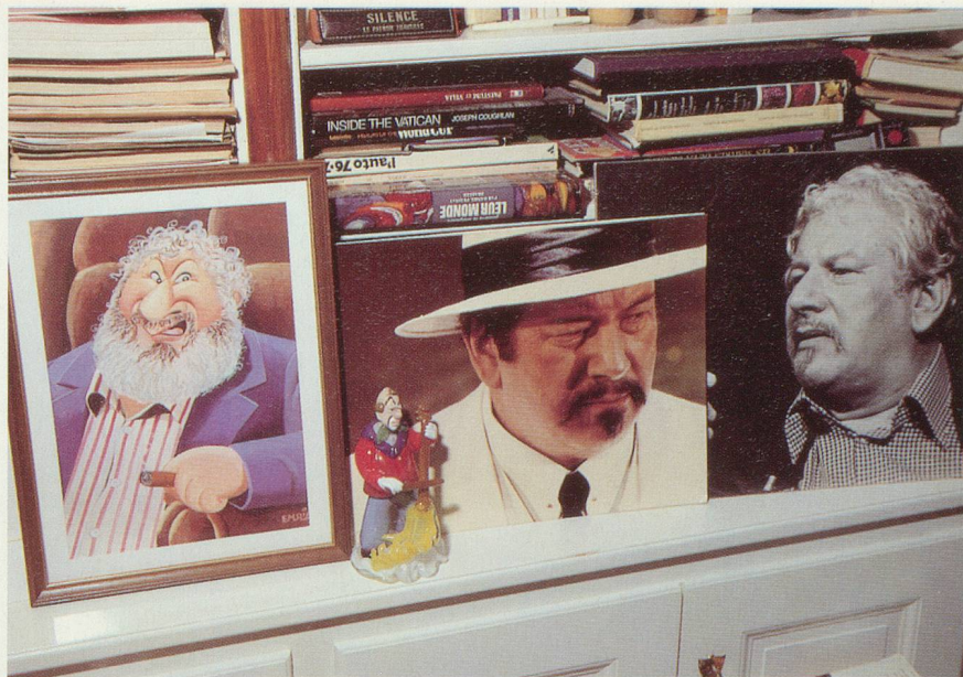
Le monde est une scène immense où il joue plusieurs rôles

– Oui, je fabrique du vin. En fait, je vends le jus de raisin à un producteur qui me retourne quelques bouteilles. J'en fais cadeau à mes amis et j'en offre aux visiteurs.