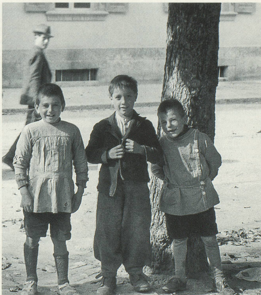
Trois petits Sédunois souriants en 1920