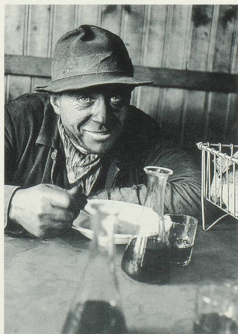
Un mineur de Chandoline en 1942