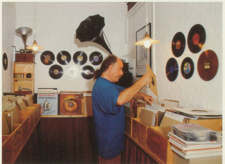
Le passionné de jazz dans son royaume...