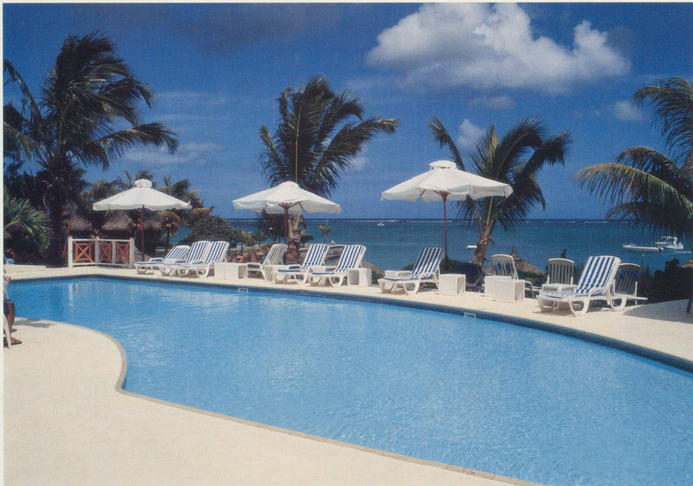
La plage et la piscine de l'Hôtel Mont Choisy, à Trou-aux-Biches

Comme elle semble perdue au bout du monde, la petite île Maurice ! Pourtant, on s'y sent rapidement aussi bien qu'un poisson dans l'eau transparente du lagon. Parce que ses habitants sont à l'image de la nature, chaleureux, généreux et respectueux des autres.