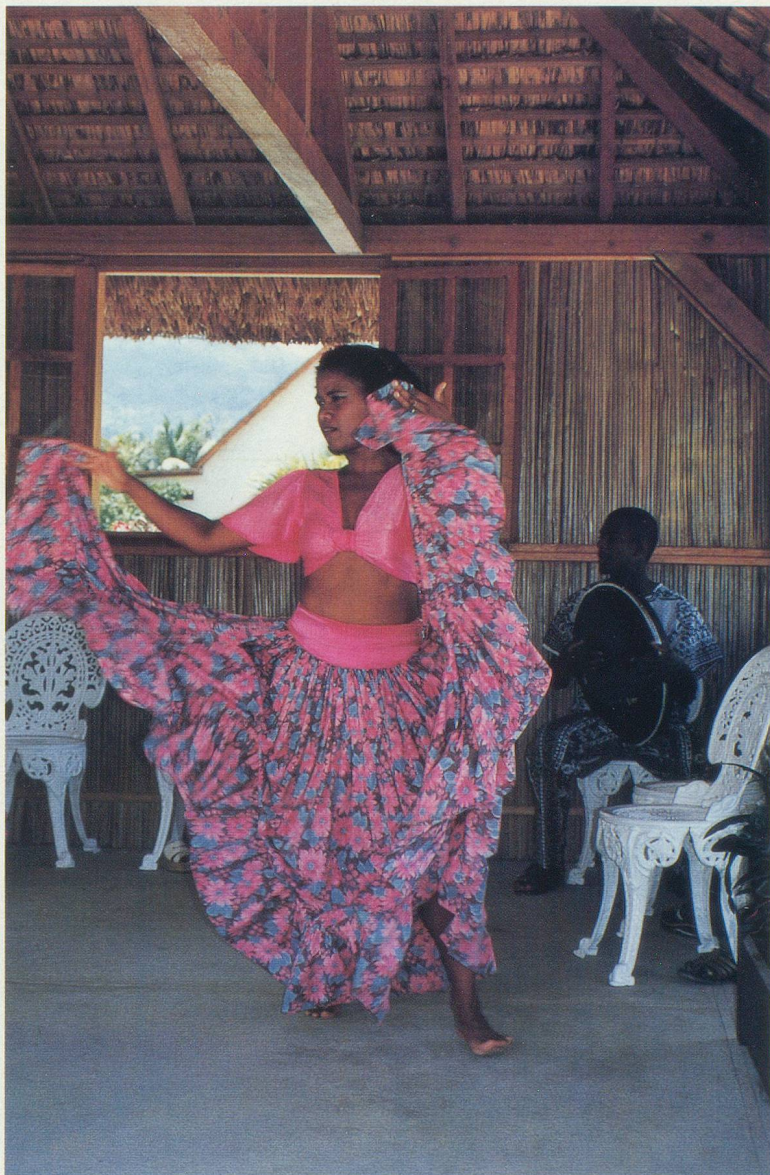
Au Domaine des Pailles, une démonstration de sèga, la danse traditionnelle

A dix minutes en voiture de la capitale, Port Louis, le Domaine des Pailles fait oublier l'agitation de la ville. Créé en 1991, ce parc de 1500 hectares a pour vocation de faire revivre l'époque coloniale. Le visiteur quitte son véhicule au parking pour monter dans une belle calèche. Le voyage dans le temps commence. Arrêt au moulin à sucre: comme au 18 e siècle, les cannes y sont pressées une à une, tandis qu'un buffle a remplacé l'esclave qui tournait la roue. Le jus de canne, récolté dans des cuves, est ensuite chauffé au feu de