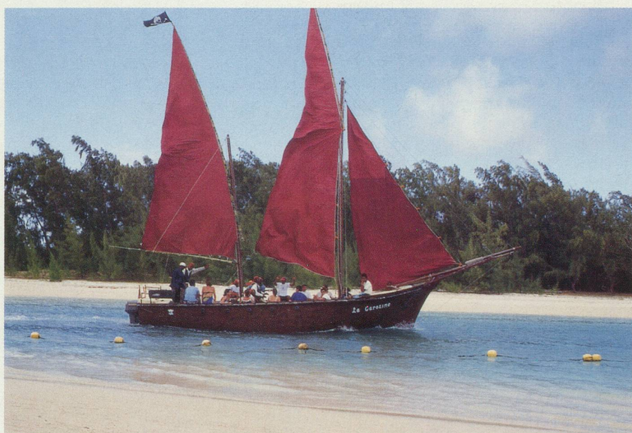
Toutes sortes d'embarcations se rendent à l'île aux Cerfs