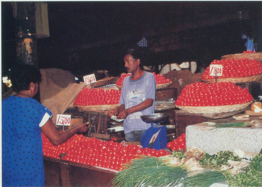
Le marché de Port-Louis, où chaque tomate est soigneusement empilée

La saison la plus chaude, l'été dans cette partie de l'océan Indien, commence en novembre et dure jusqu'en avril. La température s'élève alors à 30-35°, tandis qu'en «hiver», c'est-à-dire de juillet à septembre, il ne fait que 20-25°... Quant à la température de l'eau, elle ne descend jamais en-dessous de 22°. Le vent donne un agréable sentiment de fraîcheur. Et les hôtels étant climatisés, les nuits sont à la température que vous souhaitez! C'est en novembre et décembre que les cyclones peuvent balayer l'île. Comme les maisons sont bien conçues, en béton et peu élevées, les dégâts pour les habitants sont assez limités. La nature paie parfois un plus lourd tribut au vent, qui peut souffler à 150 km/heure. Depuis quelques années, les cyclones ont tendance à passer au large de l'île. Mais ces manifestations des forces de la nature sont actuellement bien connues et la radio se charge d'avertir les habitants.