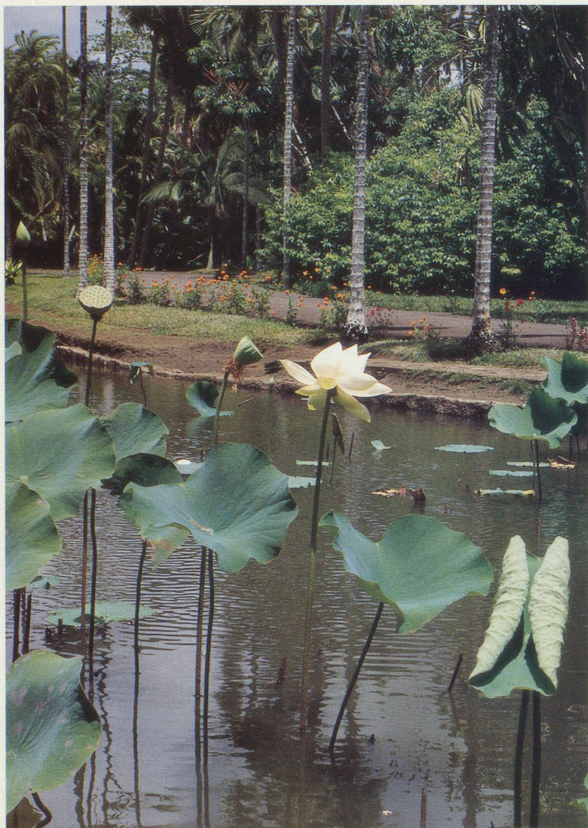
Les lotus fleurissent au Jardin de Pamplemousses

par une promenade en Land Rover, un petit safari dans les forêts voisines où l'on observe la faune et la flore des montagnes.