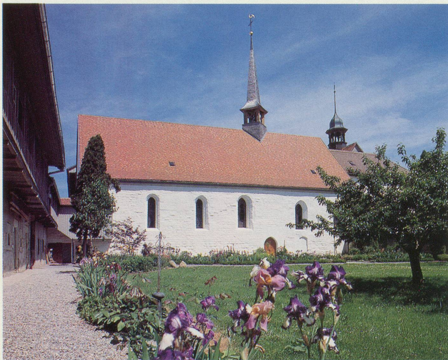
L'Abbaye cistercienne de la Fille-Dieu à Romont

Ce sont les sœurs qui ont présidé à la restauration, en 1996, de leur lieu de culte. Avec un goût parfait, elles ont plébiscité l'œuvre de Brian Clarke. L'abbaye, avec sa clarté naturelle, soulignée par le coffrage en bois du plafond et par les vitraux de Clarke, respire aujourd'hui la joie. Ces vitraux non-figuratifs aux couleurs très vives, bleu, orange, vert