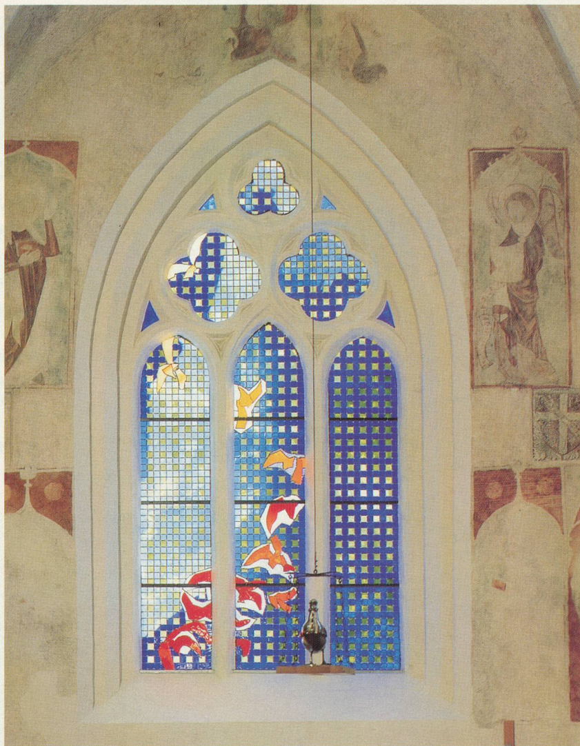
Un superbe vitrail de Brian Clarke

Pâques à Romont, c'est aussi la procession des pleureuses. On sait que depuis 1456, une confrérie organisait dans la ville un Mystère de la Passion. Le rite se modifie au cours des siècles. Dès le 19 e siècle, les pleureuses seules participent à la procession du Vendredi saint, dissimulées sous des voiles noirs, escortant une femme qui incarne la Vierge en deuil. C'est un moment fort pour les Romontois, qui craignent un peu que la cérémonie ne se transforme en fête touristique.