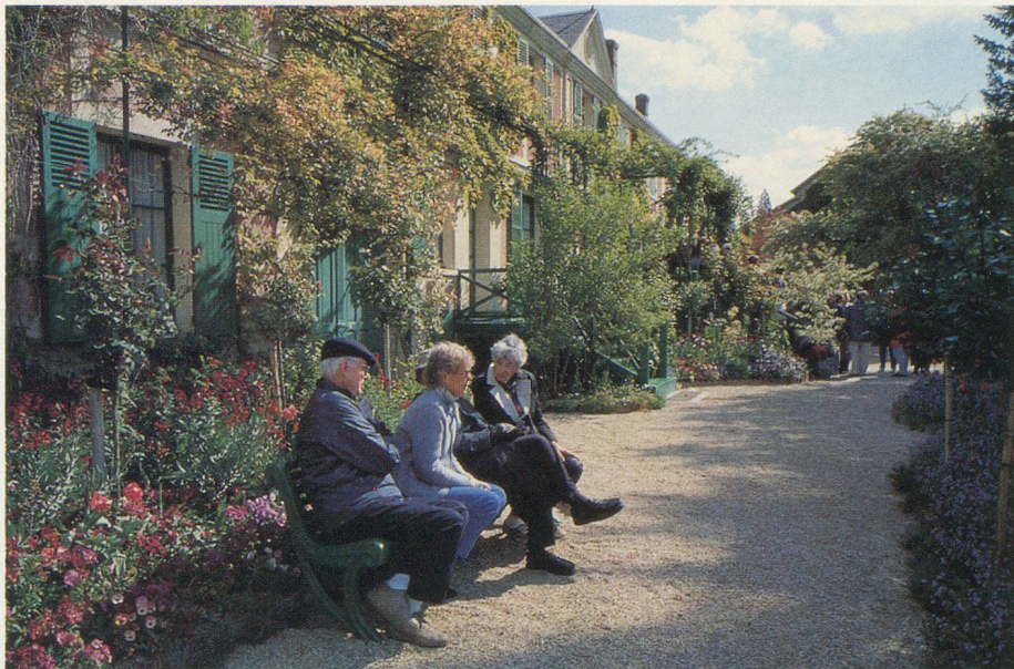
Des visiteurs se reposent devant la maison de Giverny

Giverny est un lieu préservé, hors du temps. L'atelier du peintre a été transformé en un vaste supermarché de l'art, où ses œuvres sont apprêtées à toutes les sauces. On les retrouve sur des posters, en cartes postales, sur des T-shirts, des parapluies, des sacs à mains et même des cendriers.