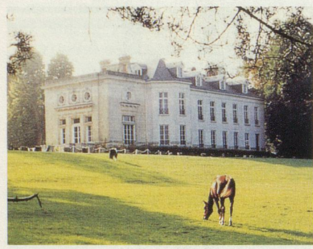
L'Hôtel-Château de Maffliers: les voyageurs y logeront

En collaboration avec les cars Marti, «Généralions» vous propose un voyage inoubliable aux sources de l'impressionnisme à Pontoise, à Auvers-sur-Oise et à Giverny. Une visite au Musée d'Orsay à Paris permettra de découvrir les plus belles œuvres de Monet, de Van Gogh, mais aussi de Pissarro et de Daubigny.