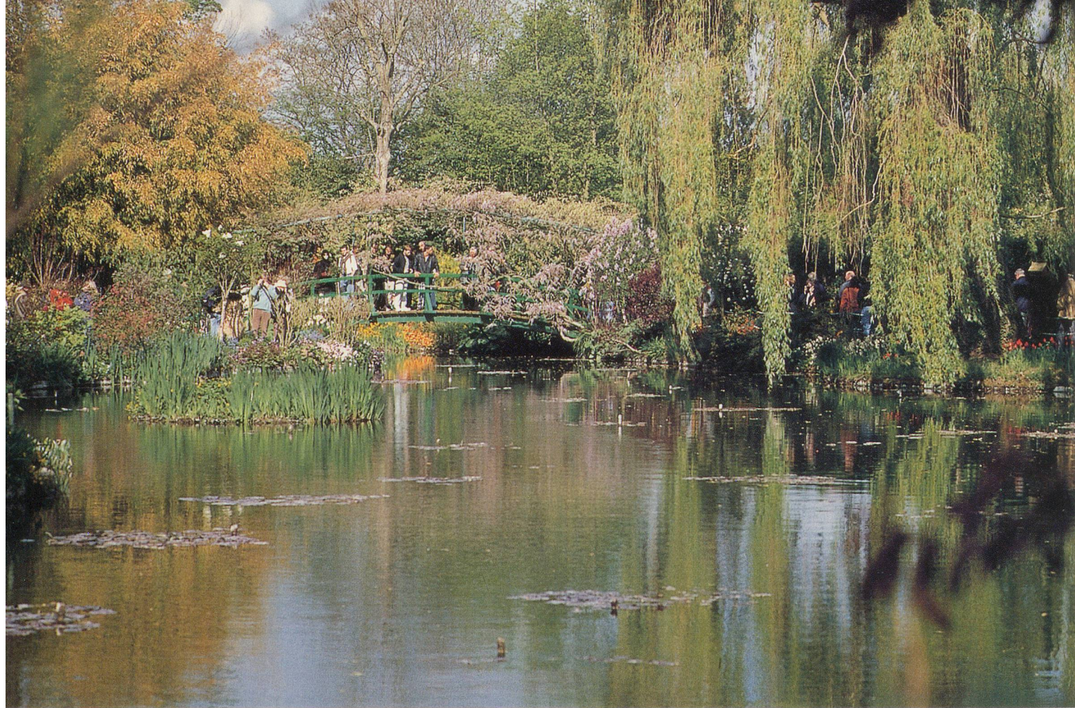
Le superbe étang des nymphéas, dans la propriété de Claude Monet