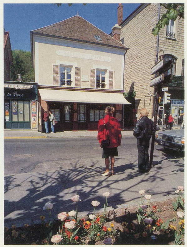
L'auberge Ravoux, où Van Gogh passa la fin de sa vie

Samedi 9 mai Après le petit déjeuner, visite de la vieille ville de Pontoise, où Camille Pissarro puisa son inspiration. Ensuite, voyage à Auvers-sur-Oise. Visite du studio de Daubigny