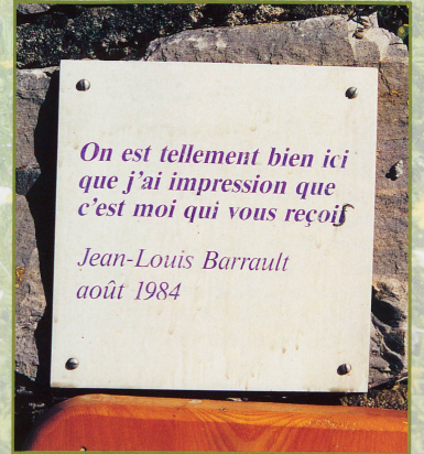
La plaque de l'irremplaçable Jean-Louis Barrault