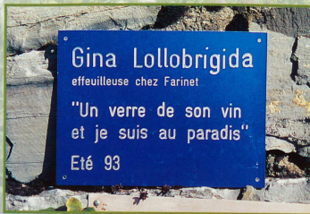
Gina Lollobrigida fut une effeuilleuse célèbre à Saillon