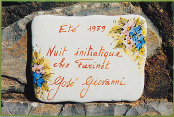
Une nuit inoubliable avec le cinéaste José Giovanni