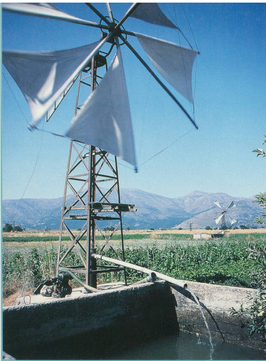
Le plateau du Lassithi et le charme de ses moulins à vent

Cette passion, qui peut même aller jusqu'à la violence, a vraisemblablement été forgée par le cours des événements de l'histoire auxquels les Crétois ont assisté. Ils ont subi le