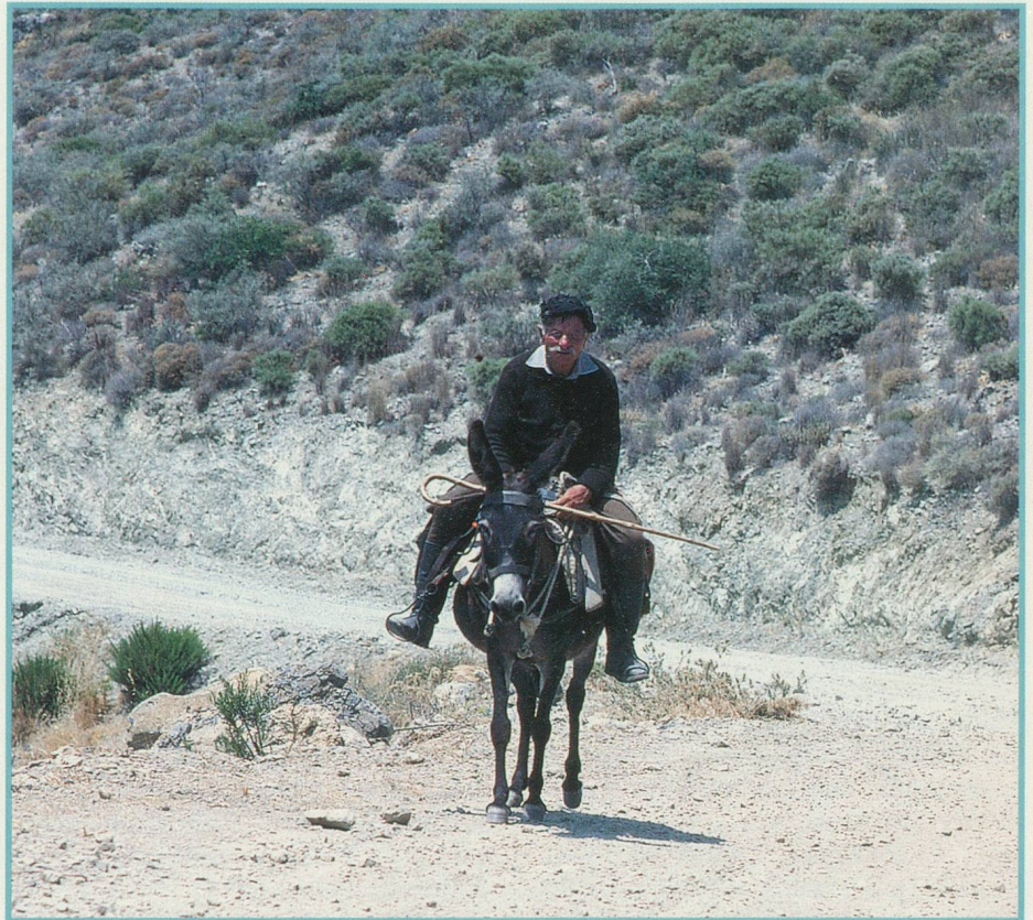
La Crète à dos d'âne, c'est l'assurance de voir l'île au rythme des autochtones...

Beaucoup de choses ont changé, mais non l'étonnante diversité des paysages et le respect des strictes lois de l'hospitalité. C'est la raison pour laquelle je vous engage à partir à la découverte de la beauté individuelle