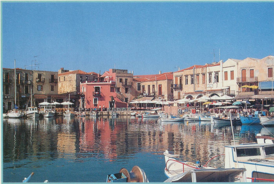
Le port Réthimnon, un havre de paix et de douceur de vivre