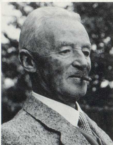
d'hui, sa propriété de Verte-Rive, à Pully, abrite le Centre Général-Guisan.

Cette mission a amené le général Guisan à prendre les décisions stratégiques dictées par la situation et son évolution tout au long de son temps de commandement. Le 20 août 1945, il quittera son commandement avec le sentiment du devoir accompli. L'estime de tout un peuple lui restera acquise jusqu'à sa mort, en 1960, et au-delà. Aujourd'hui, sa propriété de Verte-Rive, à Pully, abrite le Centre Général-Guisan.