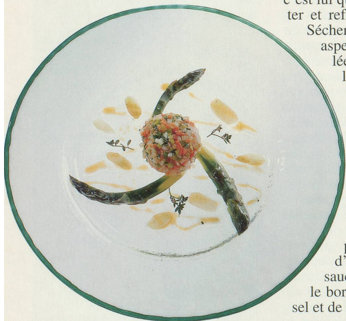
En entrée, la printanière de foie de canard

Vins recommandés: vins du Valais: Malvoisie, Amigne, aligoté, Petite Arvine.