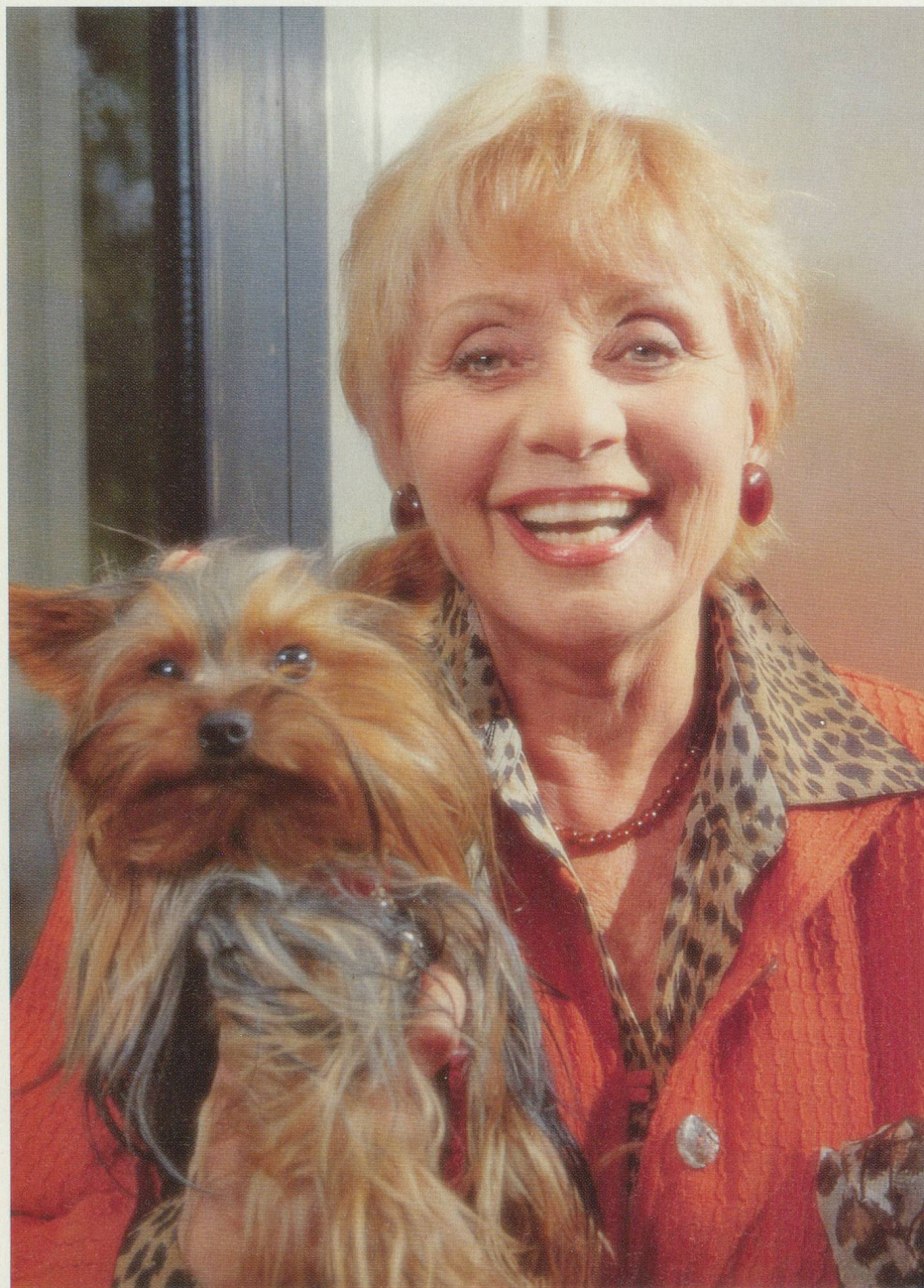
Belle complicité entre Annie Cordy et son chien Nougat

Il y a cinquante ans, Léonie Cooreman était engagée comme meneuse de revue au Lido de Paris. Devenue Annie Cordy, la chanteuse belge a fait déferler une avalanche d'éclats de rires sur toute la francophonie. Ses chansons drôles et entraînantes ont charmé plusieurs générations et le sortilège opère toujours. Nous avons tenu à vous présenter cette chanteuse éclatante de santé et de bonheur.