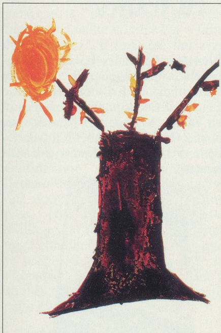
Le soleil symbolise la figure paternelle. L'enfant demande ainsi à son père d'être plus présent près du jeune arbre (c'est-à-dire lui).

P enché sur sa feuille, concentré sur son œuvre, un enfant couvre une page de gribouillages colorés. L'énergie et l'attention qu'il met à représenter le monde qui l'entoure est touchante. Les traits, même ceux qu'il semble avoir laissés au hasard, dénotent une organisation bien personnelle du monde. Ne dites pas que vous n'avez jamais été attendri par l'un