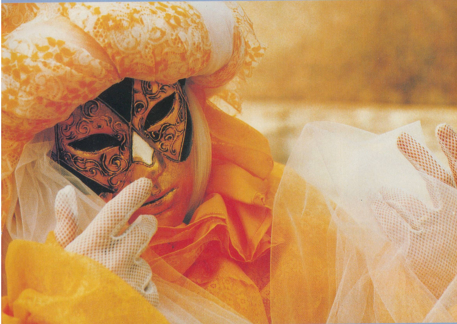
Les costumes sont taillés dans des tissus précieux