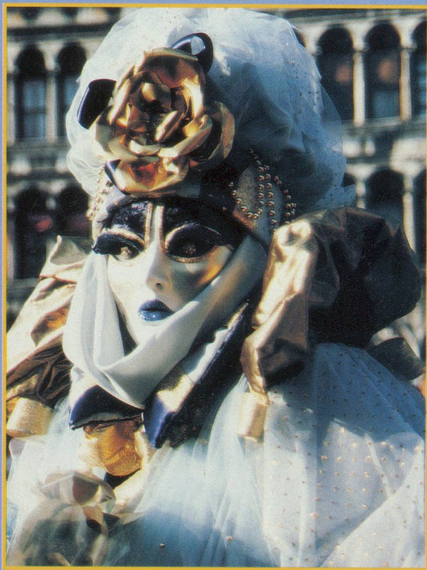
La Reine des Neiges sur la place Saint-Marc