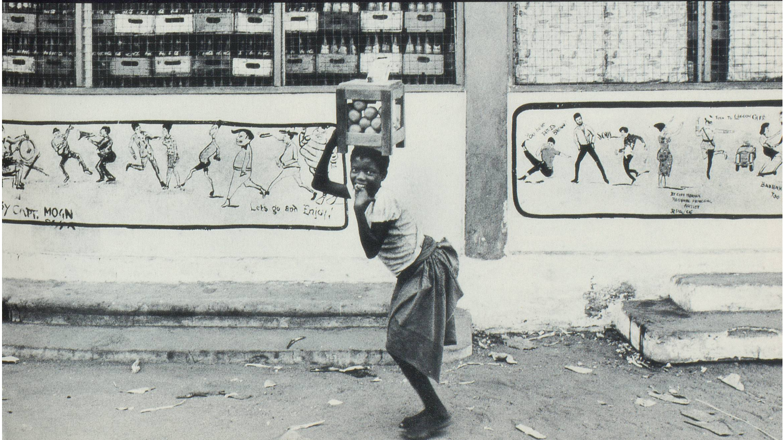
Marchande d'oranges à Accra, Ghana