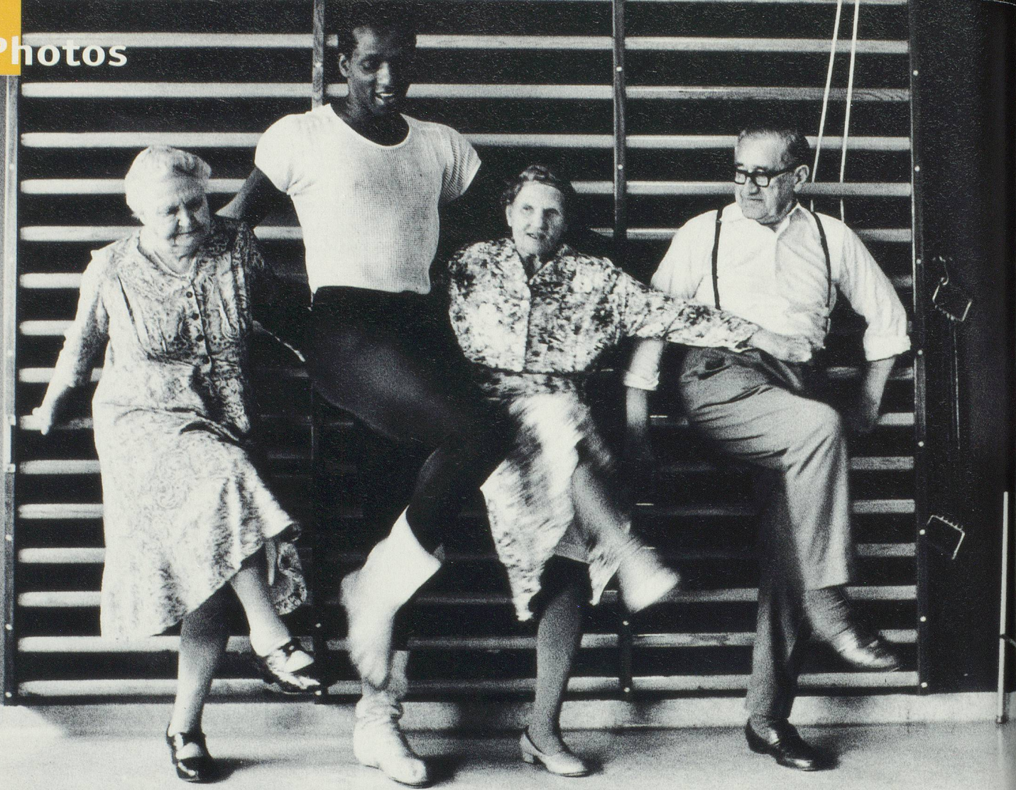
Leçon de jazz-dance dans un EMS de Copenhague