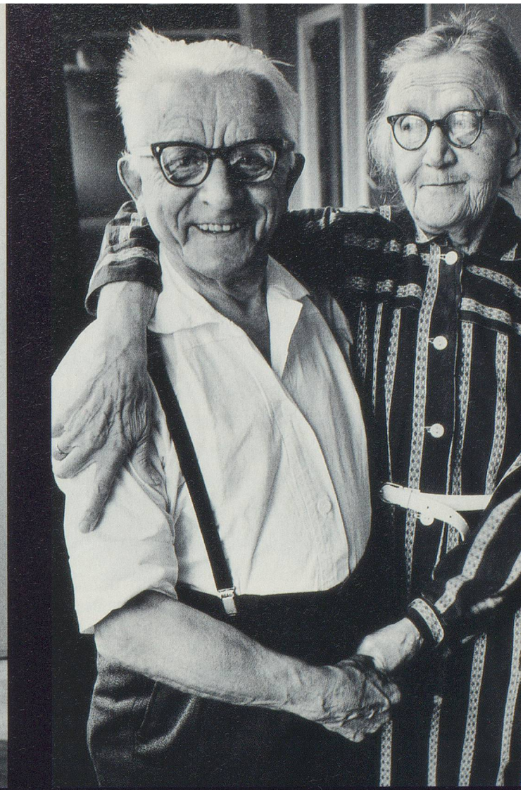
Deux amoureux du troisième âge au Danemark