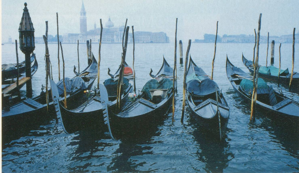
La célèbre lagune et ses inévitables gondoles

Superbe croisière de six jours sur la lagune de Venise et remontée du Pô vers Ferrare par Santa Maria Magdalena, à bord du MS Michelangelo .