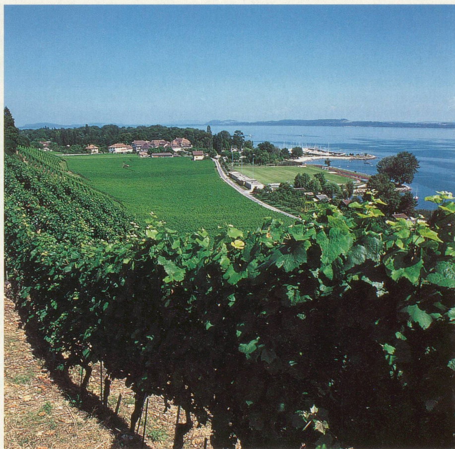
Le sentier descend en plein vignoble