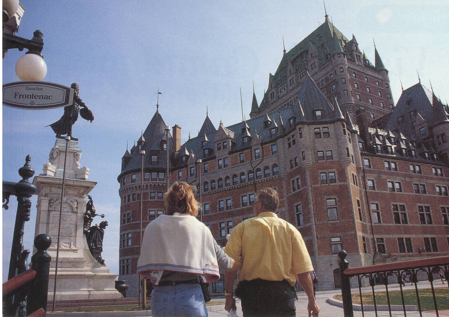
Le célèbre Château Frontenac surplombe le port de Québec