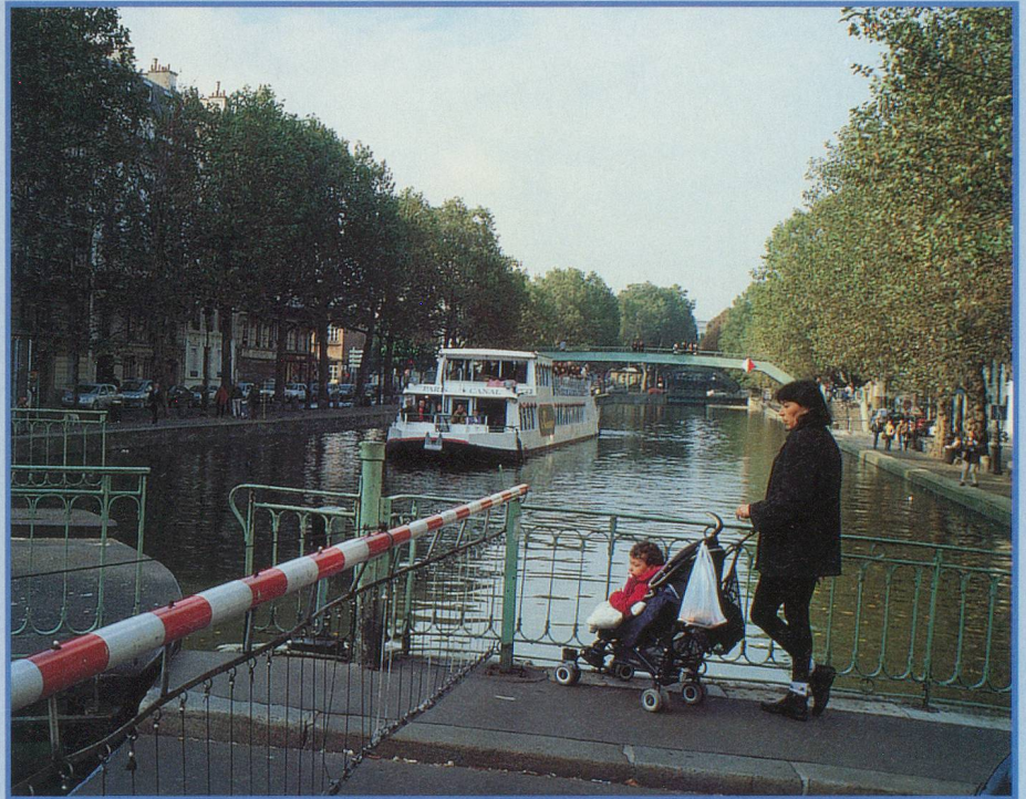
La rue Dieu tourne sur elle-même pour laisser le passage aux bateaux

A quelques pas du canal, peu après l'Hôpital Saint-Louis, une plaque commémorative rappelle l'emplacement du tristement célèbre gibet de Montfaucon. Au numéro 49 de la rue de la Grange-aux-Belles rôdent encore les fantômes de milliers de pendus exécutés entre le 14 e et le 17 e