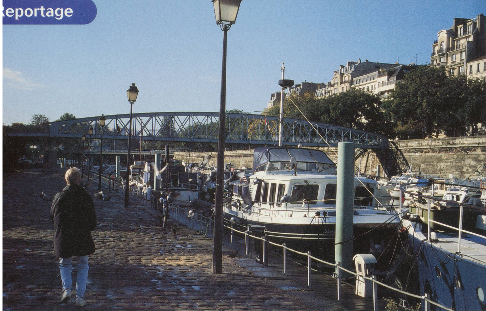
Entre la Seine et la Bastille, il fait bon flâner sur le port de Paris

siècle. Souvenons-nous, en passant, que le poète François Villon manqua de peu de s'y balancer et qu'il y composa sa Ballade des pendus .