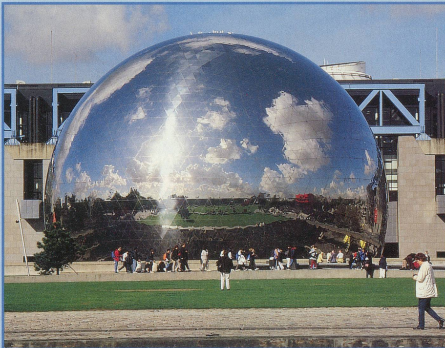
Au bout du bassin de la Villette trône l'imposante géode