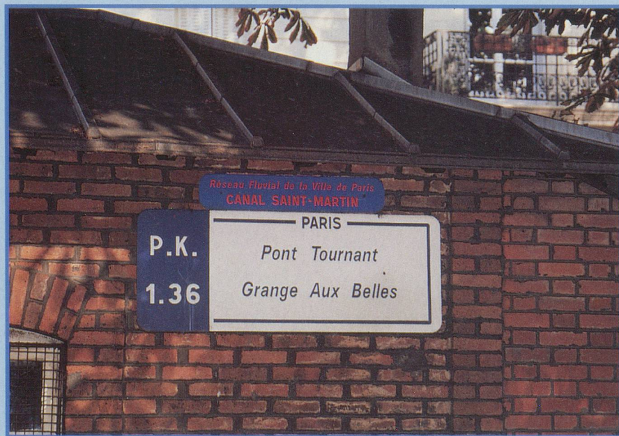
Les ponts tournants sont une curiosité du canal Saint-Martin