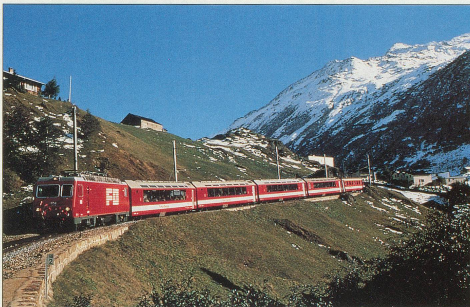
Un panorama d'une grande beauté

Mardi 3 juillet: Petit-déjeuner à l'hôtel. Journée consacrée à la découverte de cette magnifique région de l'Engadine. 10 h: départ en bus pour Pontresina. A partir de Pontresina, continuation en calèche jusqu'à Val Roseg. Repas de midi et retour en calèche, puis en car jusqu'à Saint-Moritz. Repas du soir à l'hôtel, logement à l'hôtel.