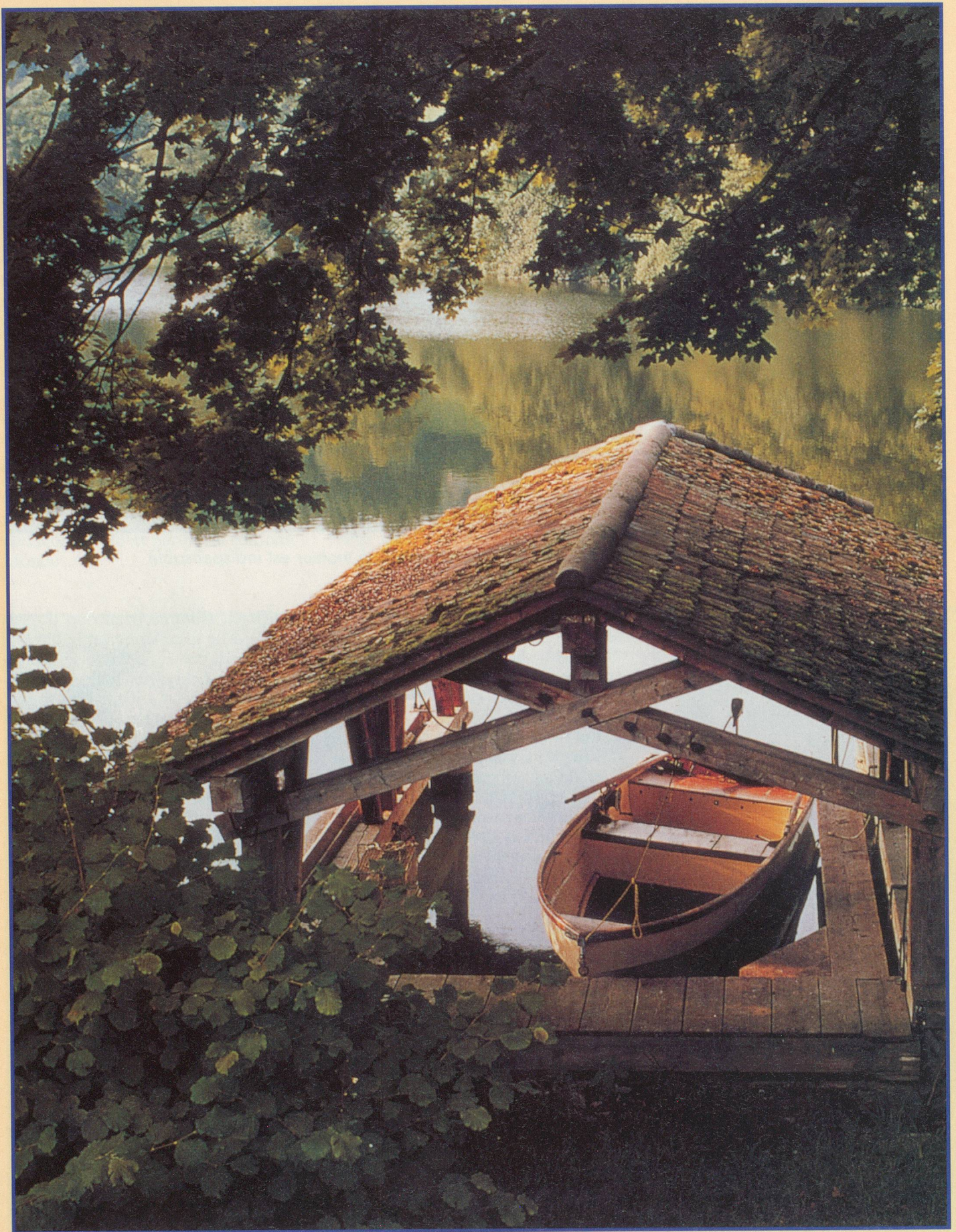
Sur le Mauensee, une île privée de l'arrière-pays lucernois