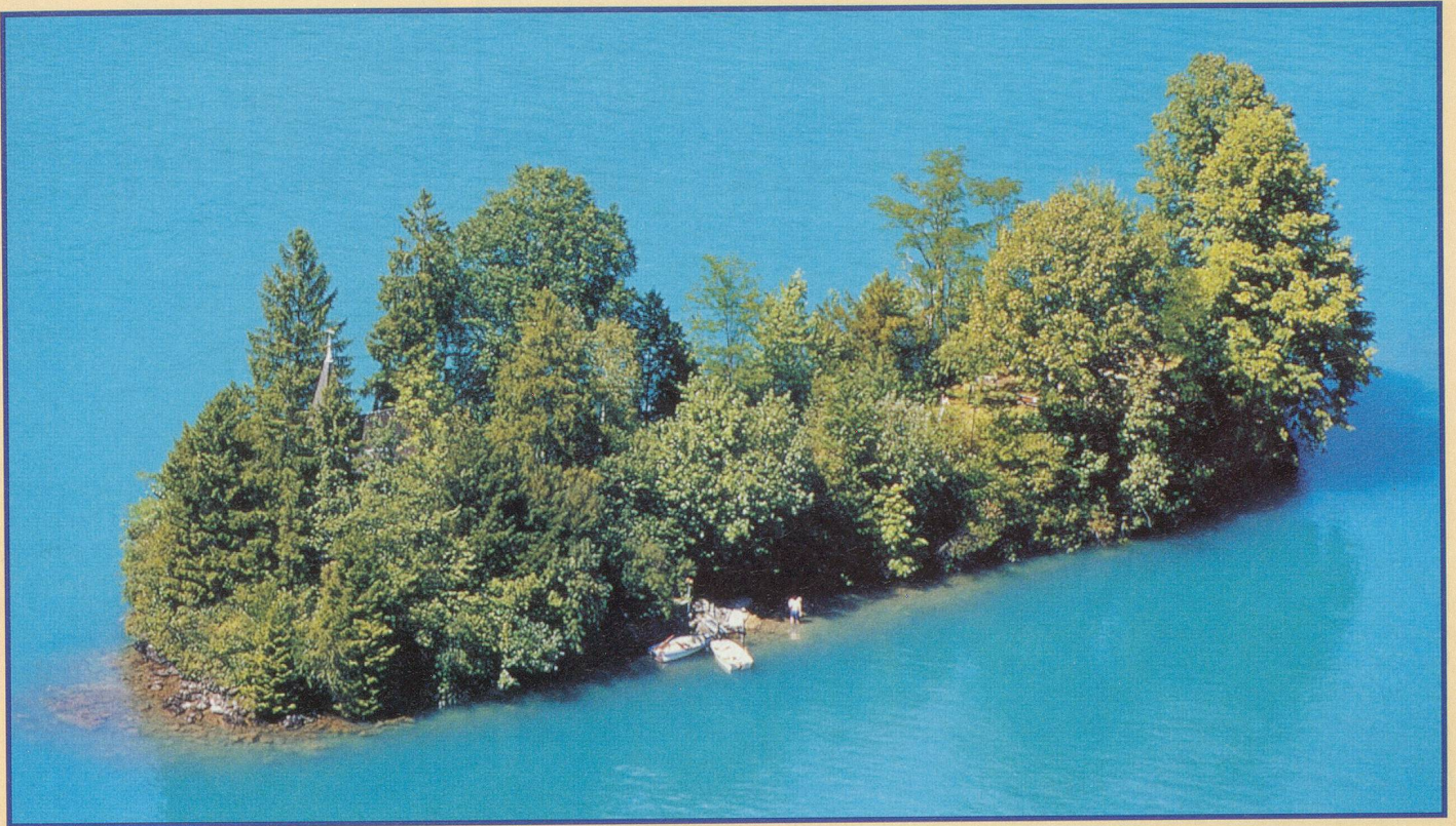
L'île des Escargots, ou Schneckeninsel, près d'Iseltwald, à quelques kilomètres d'Interlaken (BE)