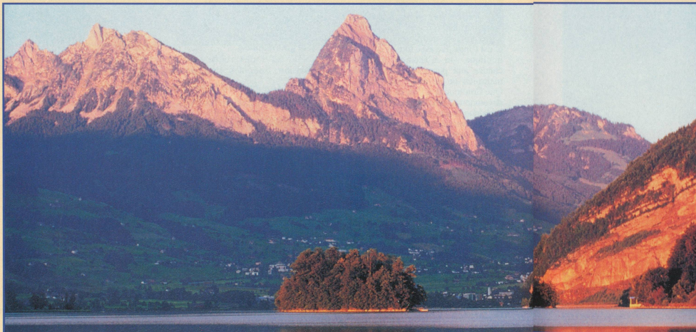
L'île de Schwanau, lieu d'excursion apprécié, sur le Lauersee, près de Schwyz

bac de dix tonnes que ces agriculteurs charrient régulièrement sacs d'ordures, bétail et autres outils indispensables.