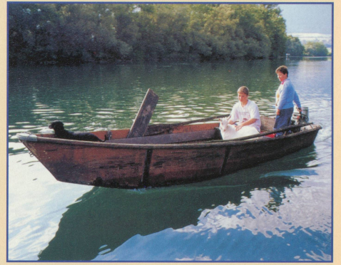
Pour aller à l'école, le bateau à moteur est indispensable

Pour les insulaires, la vie est particulière, même en Suisse. Sur l'île de Länggrein, sur l'Aar, à six kilomètres en amont de Soleure, une famille de paysans cultive aujourd'hui encore les sept hectares de cette terre en forme de losange, bordée d'arbres. Pour les enfants, un seul moyen d'aller à l'école, la barque à moteur. Et c'est grâce à un