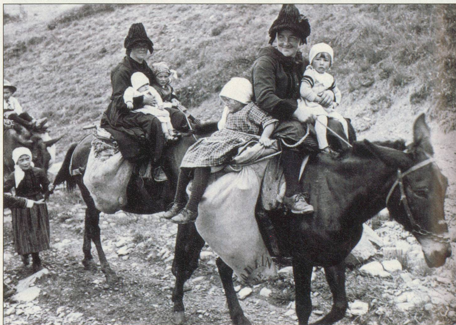
Toute la famille se déplaçait avec son mulet