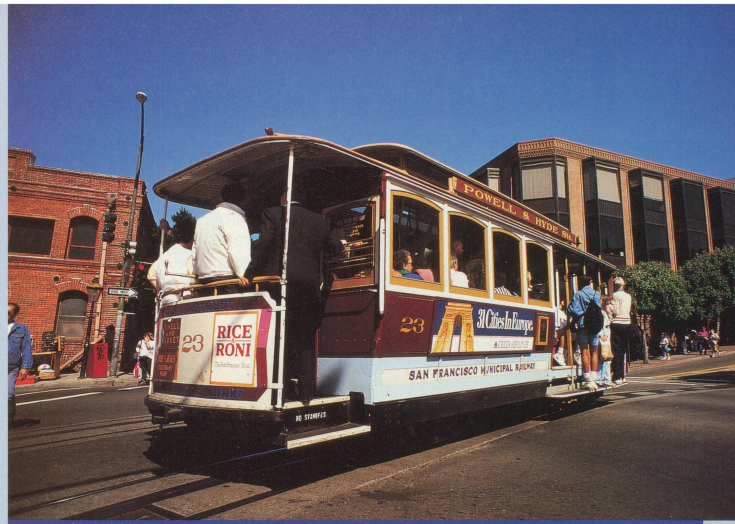
Maintes fois célébré au cinéma, le tramway (cable car) de San Francisco

rôles de figurants dans les westerns. Pourtant, des vestiges existent encore, qui racontent mieux qu'au cinéma l'histoire des Peaux-Rouges. Perché à une vingtaine de mètres au fond de la vallée de Beaver Creek, Montezuma Castle abritait, au 12 e siècle, les Indiens Sinaguas. Dans cet extraordinaire édifice de cinq étages creusé dans le rocher auquel ils accédaient à l'aide d'échelles, les autochtones étaient à l'abri de la chaleur du jour, du froid nocturne et des intempéries. Mais également des attaques