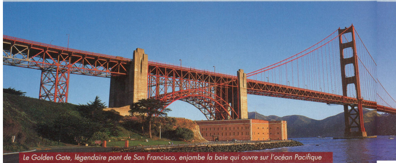
Le Golden Gate, légendaire pont de San Francisco, enjambe la baie qui ouvre sur l'océan Pacifique