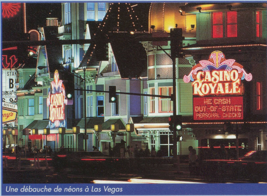
Une débauche de néons à Las Vegas

projeté des images sur un écran démesuré (Imax). Il ne faut pas quitter la rive sud du Grand Canyon sans avoir assisté à un lever de soleil (vers 5 heures) et à un coucher de soleil (vers 19 heures). Ces images fortes laissent dans la mémoire une empreinte au moins aussi dure que le rocher aux couleurs changeantes.