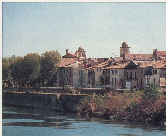
Une vue de la charmante cité arlésienne

(Suppl. cabine indiv. Fr. 100.-) (Suppl. pont supérieur Fr. 60.-)