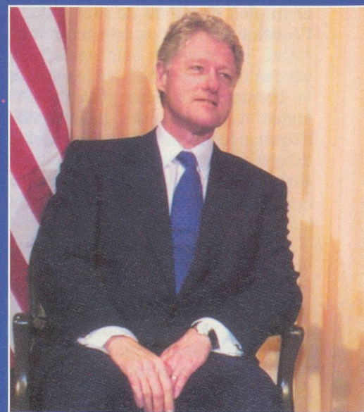
Avec Bill Clinton au Forum de Davos