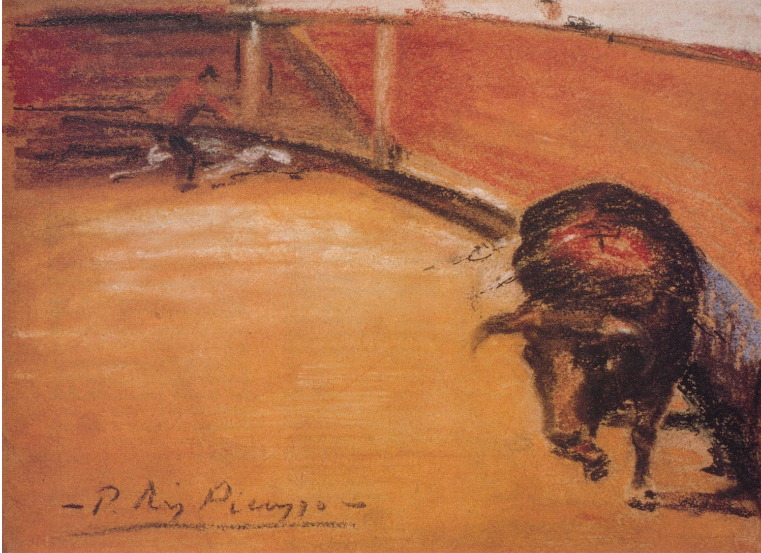
Taureau dans l'arène, pastel sur carton, vers 1900

pour sauver l'humanité. Il y aurait ainsi un salut possible, l'un en sacrifiant un dieu à forme animale, l'autre un dieu à visage humain.