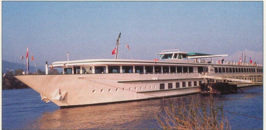
Le MS Rhône Princess au fil de l'eau

Lundi 29 octobre. Le matin, visite guidée facultative de Lyon. Déjeuner à bord et continuation jusqu'à Colonges-au-Mont-d'Or. Escale devant