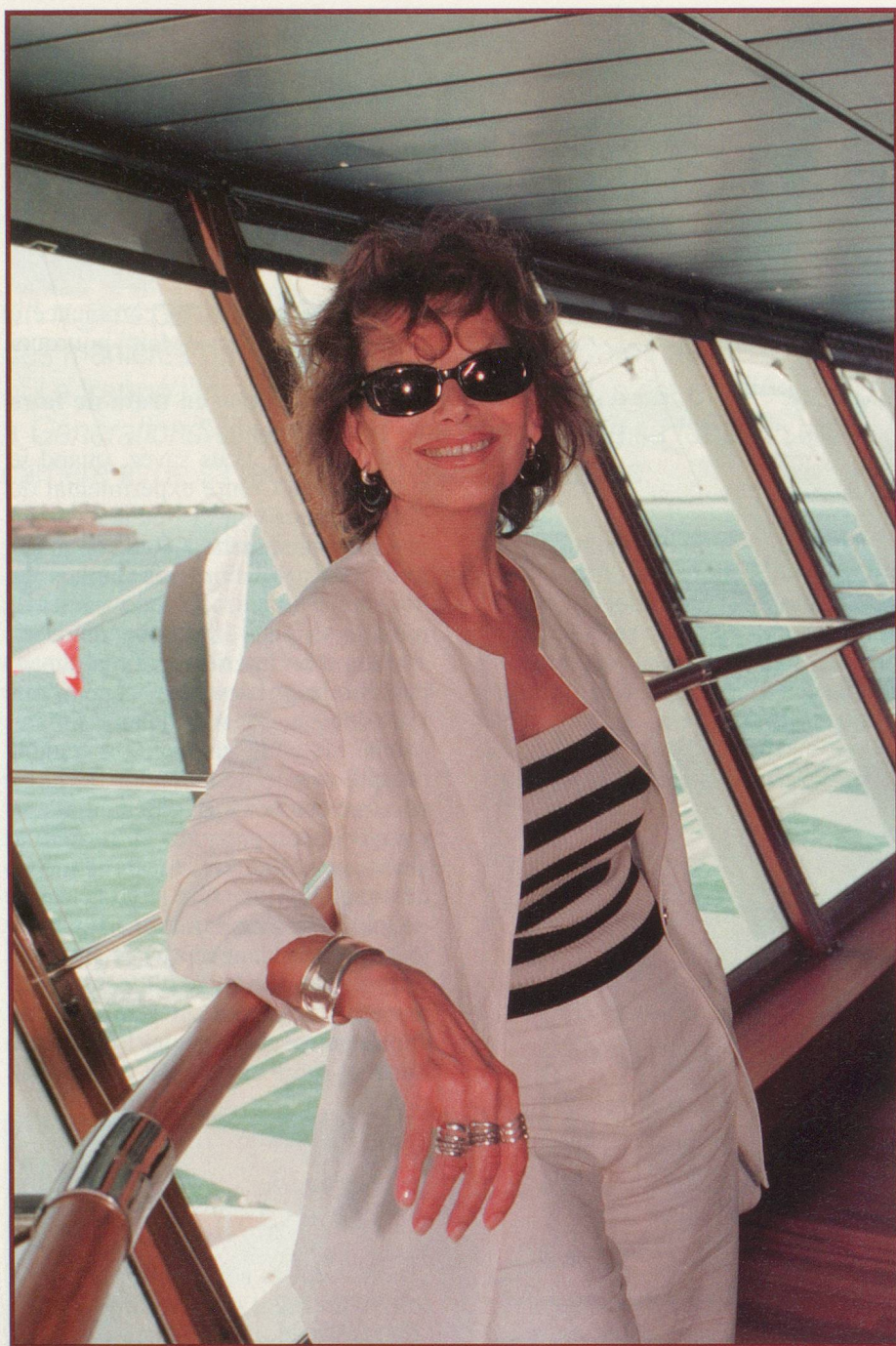
Claudia Cardinale en capitaine de yacht, un rôle complètement improvisé

parce que j'ai toujours pensé que ce n'était pas une bonne chose de se construire un masque.