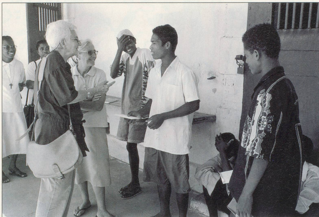
A Madagascar, grâce à DiDé, ces mineurs ont retrouvé une vie décente

de sa fonction de déléguée. Elle se rappelle combien il est dur, quand on visite les prisons, de devoir dire: «Nous regrettons, mais ce n'est pas notre mandat et nous ne pouvons pas intervenir...»