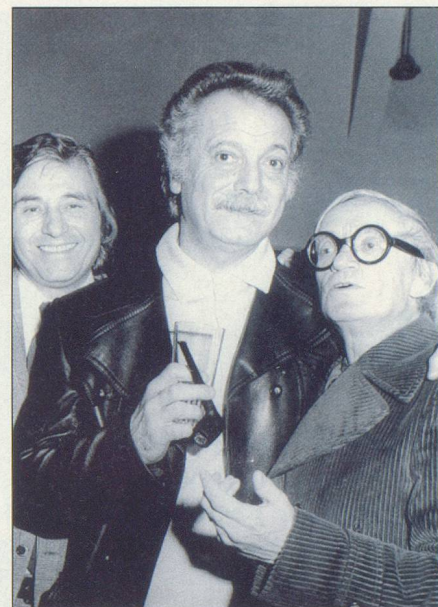
Bonjour Brassens, Editions du Félin

A l'étage inférieur, le poète avait aménagé une petite salle de musique, donnant sur un jardinet pas plus grand qu'un mouchoir de poche. Il s'était mis à l'orgue et avait entonné