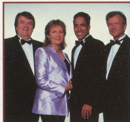
Alain Morisod et Sweet People

Six jours en mer pour une croisière inoubliable sur le Club Med 2 , un paquebot à voiles de 196 cabines qui marie luxe, raffinement et confort hôtelier. Animation à bord assurée par Alain Morisod et Sweet People.