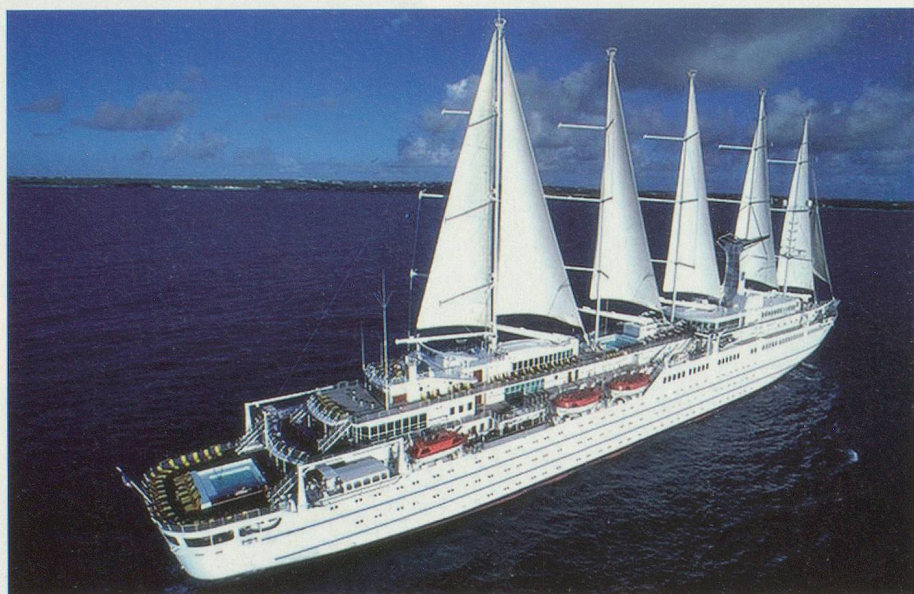
Le Club Med 2, un paquebot qui allie élégance et confort

OFFRE SPÉCIALE: DU 7 AU 12 SEPTEMBRE 2002