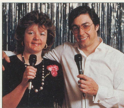
Le Duo Atlantis pour l'animation