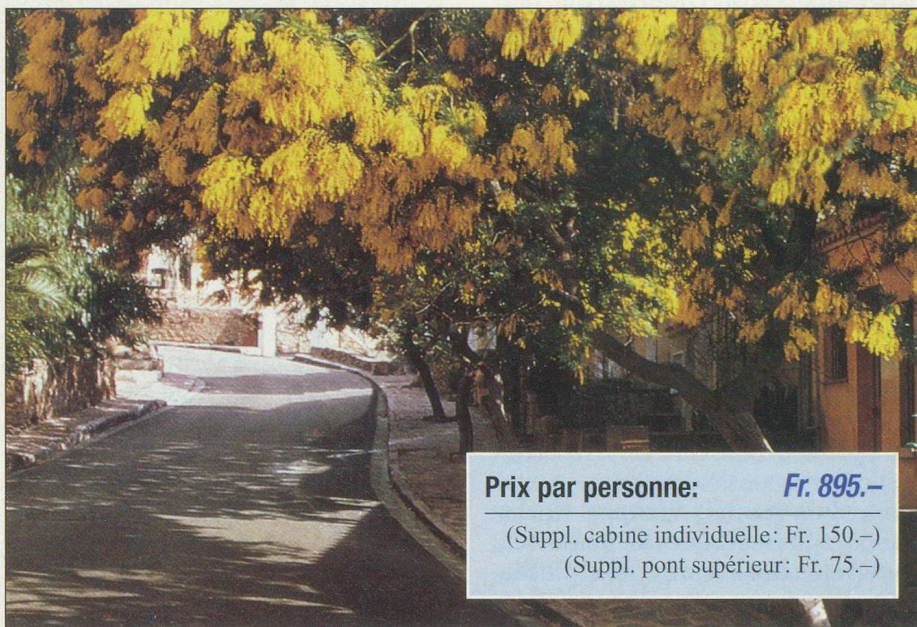
Vision enchantée à Bormes-les-Mimosas

Inclus dans le prix: le transfert en car aller et retour; la croisière en pension complète, du déjeuner du premier jour au petit déjeuner du dernier jour; le logement en cabine extérieure climatisée, douche et w.-c.; le drink d'accueil; l'assistance de notre hôtesse; un accompagnant; les taxes portuaires; l'animation avec le Duo Atlantis. (Non compris: assurances, boissons, excursions facultatives, les pourboires).