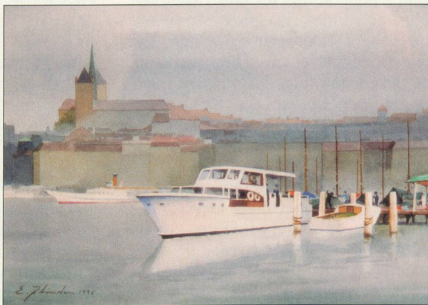
Genève, son port, sa cathédrale

fasciné l'artiste. Il y a une dizaine d'années, il avait peint «La sorcière du désert», et il en parlait en ces termes: «Elle vous dit: prenez garde, si vous continuez ainsi, c'est le monde que vous menacez de désertification. Et puis, dans sa main, reste la faucille, le marteau a disparu. C'est la chute des idéologies...»