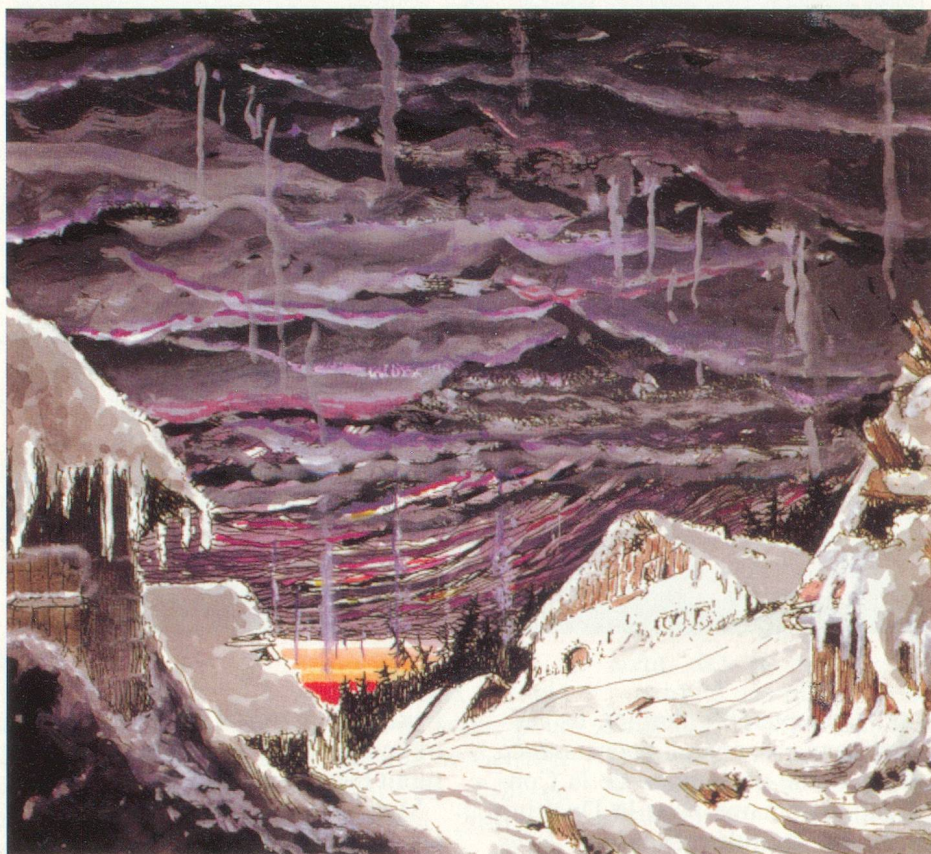
Aquarelle de Remy Grosjean

Certains sont parvenus, comme Boris, à bricoler des foyers de fortune où ils brûlent leur huile de chauffage. Il faudra généraliser ce procédé, tout