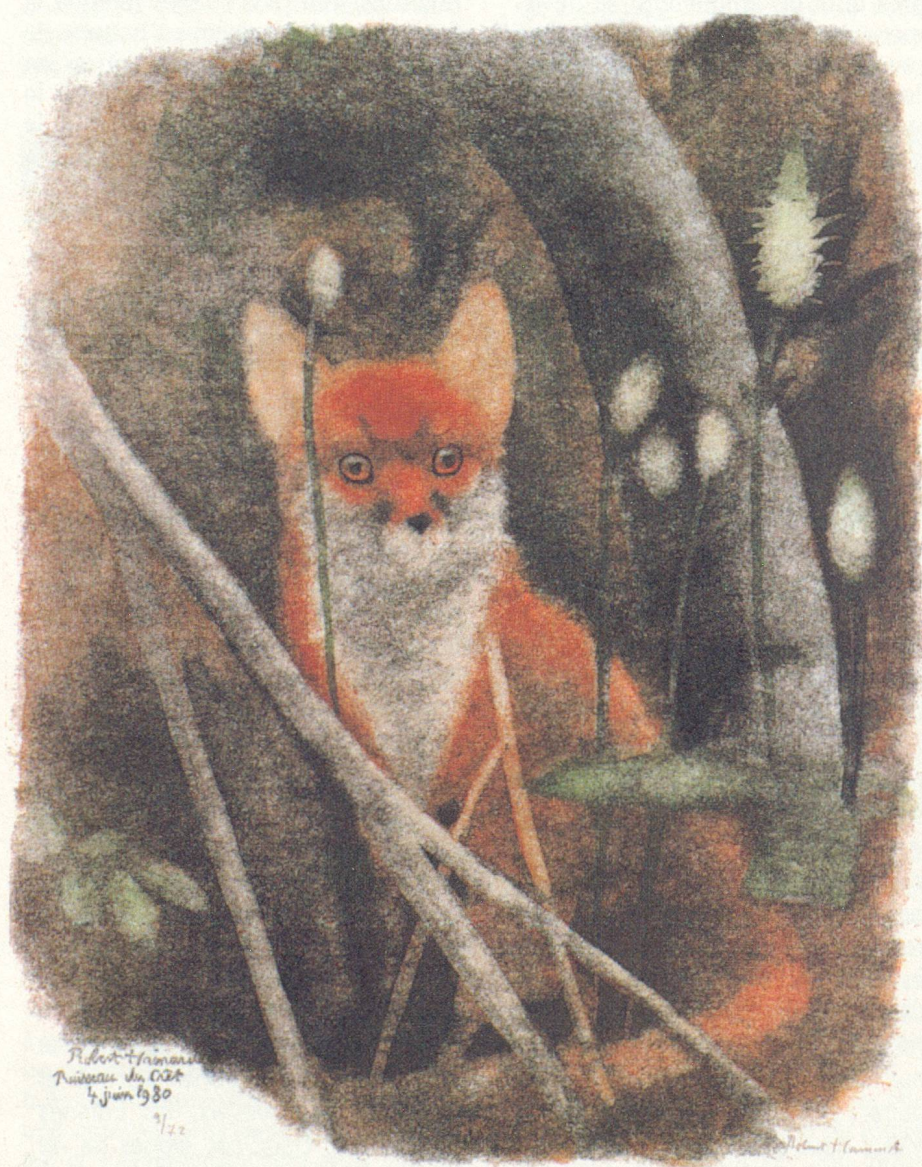
Un renardeau émancipé, saisi au ruisseau du Crêt, en juin 1980