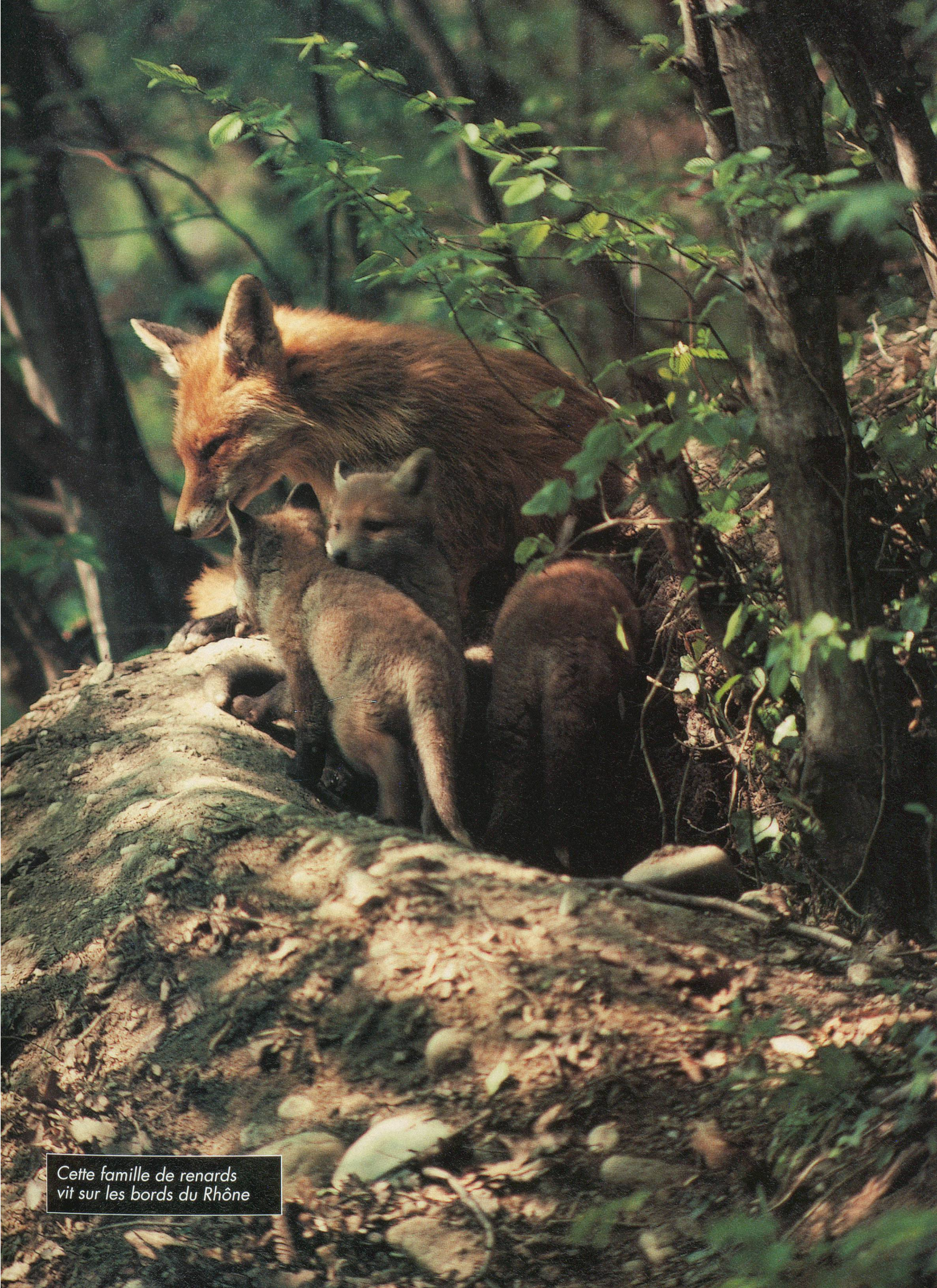
Cette famille de renards vit sur les bords du Rhône