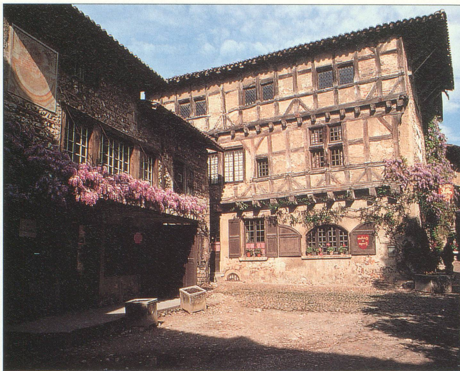
A Pérouges, toutes les maisons sont médiévales

La richesse de la région s'est bâtie sur le commerce des draps et des soieries. A Jujurieux, dans le Bugey, une entreprise familiale a perpétué ce savoir-faire sophistiqué. La visite des entreprises Bonnet vous replonge dans les réalités industrielles des 19 e et 20 e siècles. En 1835, Claude-Joseph Bonnet fonde dans son village une manufacture. Elle emploie alors 1200 ouvriers sur ce site, dont 550 ouvrières qui vivaient dans le pensionnat de jeunes filles créé par Bonnet. Car, en plus des visées industrielles de l'entreprise, Bonnet croit dans la vocation sociale et éducative de sa fabrique, qu'il dirige avec le paternalisme typique de l'époque. Une infirmerie, une aumônerie, une chapelle, une école :