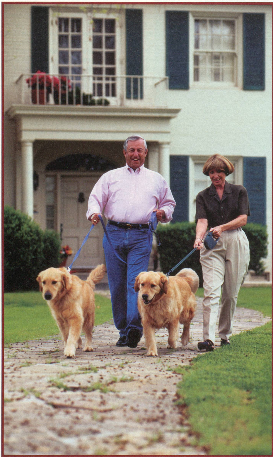
L'échange de maisons permet de séjourner à l'étranger à bon compte

Vous hésitez à partir, parce que vous ne voulez pas laisser vos cactus à l'abandon, votre jardin se dessécher, Mistigri à la rue, votre maison ou votre appartement à la merci des voleurs? Essayez l'échange de maisons. Témoignages et conseils.